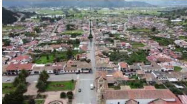
Municipio de Tibasosa.