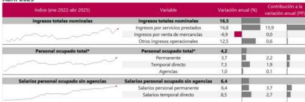
Tabla 6. Variación anual y contribución de los ingresos nominales por tipo, personal ocupado total y salarios por tipo de contratación Almacenamiento y actividades complementarias al transporte Total nacional Abril 2025 P