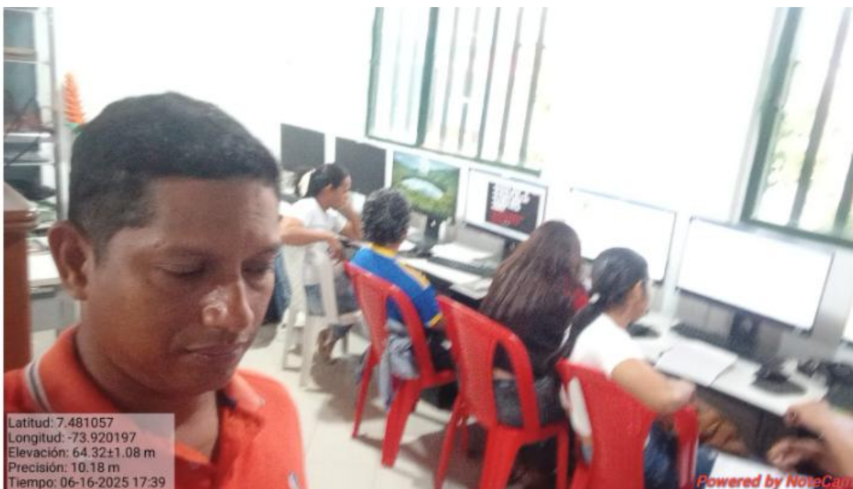
Aprendices del programa Manejo Básico de Herramientas Ofimáticas

Utilizar las herramientas de oficina, aplicando las funciones propias del procesador de palabras, hojas de cálculo y presentador de diapositivas en la resolución de problemas de acuerdo con las necesidades del cliente y las tendencias de las tecnologías de la información y de la comunicación.