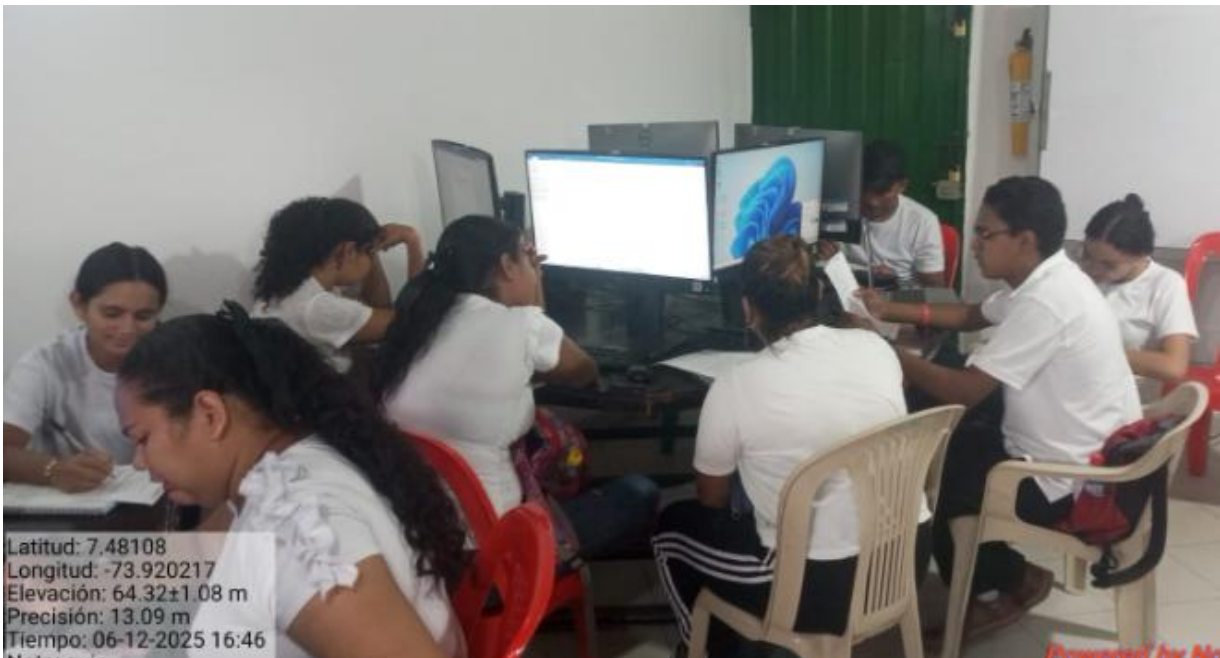
Aprendices del programa Manejo Intermedio de la Herramienta de Hojas De Cálculo

RAP 04: Realizar las acciones de mejora de acuerdo con los resultados obtenidos.