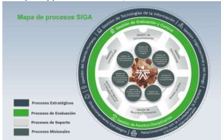
Fuente: sistema de gestión y autocontrol SENA.

sistema de gestión de calidad, atención al cliente interno y externo, gestión jurídica, gestión financiera, sistema de gestión ambiental y energética, gestión documental y gestión de la formación profesional integral, lo anterior conforme a lo indicado en el mapa de proceso de la entidad – Sistema integrado de gestión y autocontrol – SIGA- y que le son aplicables al despacho regional , como los procesos de soporte y procesos misionales, así: