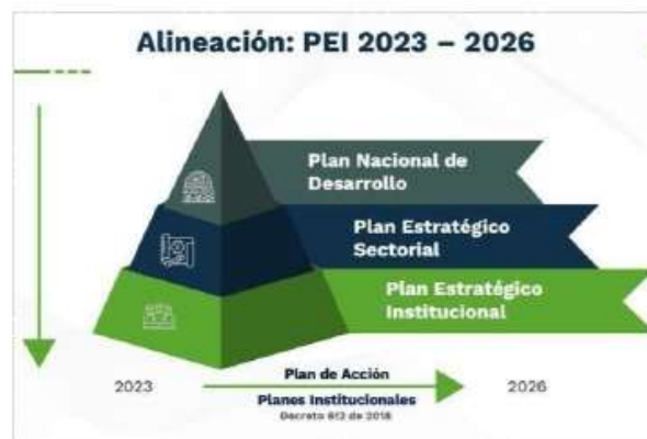
Ilustración 2 Alineación normativa PEI 2023 – 2026