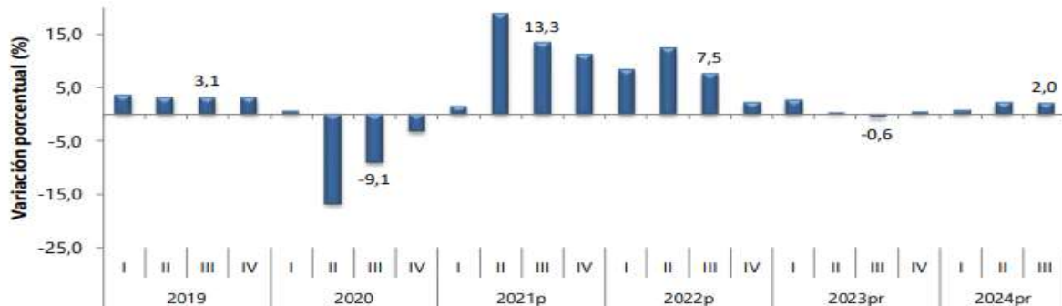
Gráfico 1. Producto Interno Bruto Tasa de crecimiento en volumen 1 2019-I / 2024pr-III