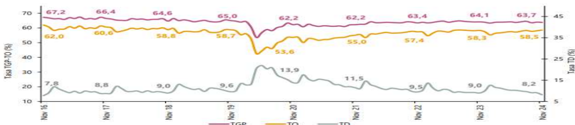
Gráfico 2. Tasa global de participación (TGP), Tasa de ocupación (TO) y Tasa de desocupación (TD) Total nacional Noviembre (2016 - 2024)

Para el mes de noviembre de 2024, la tasa de desocupación del total nacional fue 8,2%, lo que representó una disminución de 0,8 puntos porcentuales respecto al mismo mes de 2023 (9,0%). La tasa global de participación se ubicó en 63,7%, mientras que en noviembre de 2023 fue 64,1%. Finalmente, la tasa de ocupación fue 58,5%.