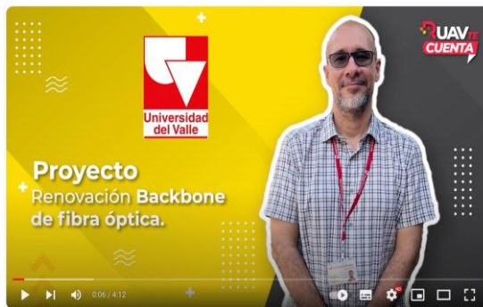
Universidad del Valle Proyecto: Renovación Backbone de fibra óptica