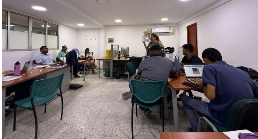
Reunión con la líder de bienestar al aprendiz; para planeación, revisión y organización de actividades ejecutadas en las respectivas sedes y nodos.