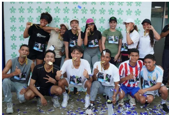
RUNING 3k corramos por nuestros sueños; actividad donde los aprendices celebran la semana del aprendiz con toda la comunidad CEDAGRO demostrando su resistencia y ganas de salir adelante por medio de esta carrera.