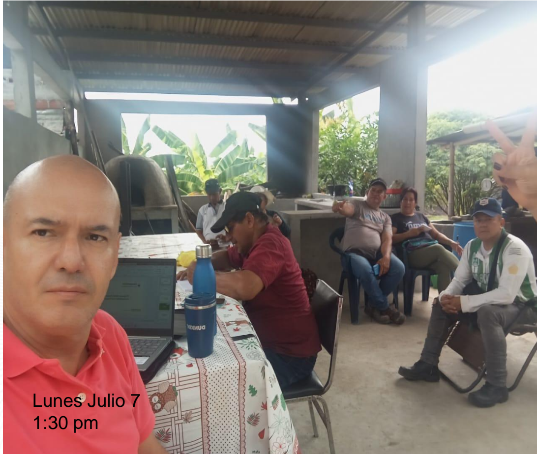
Lunes Julio 7 1:30 pm