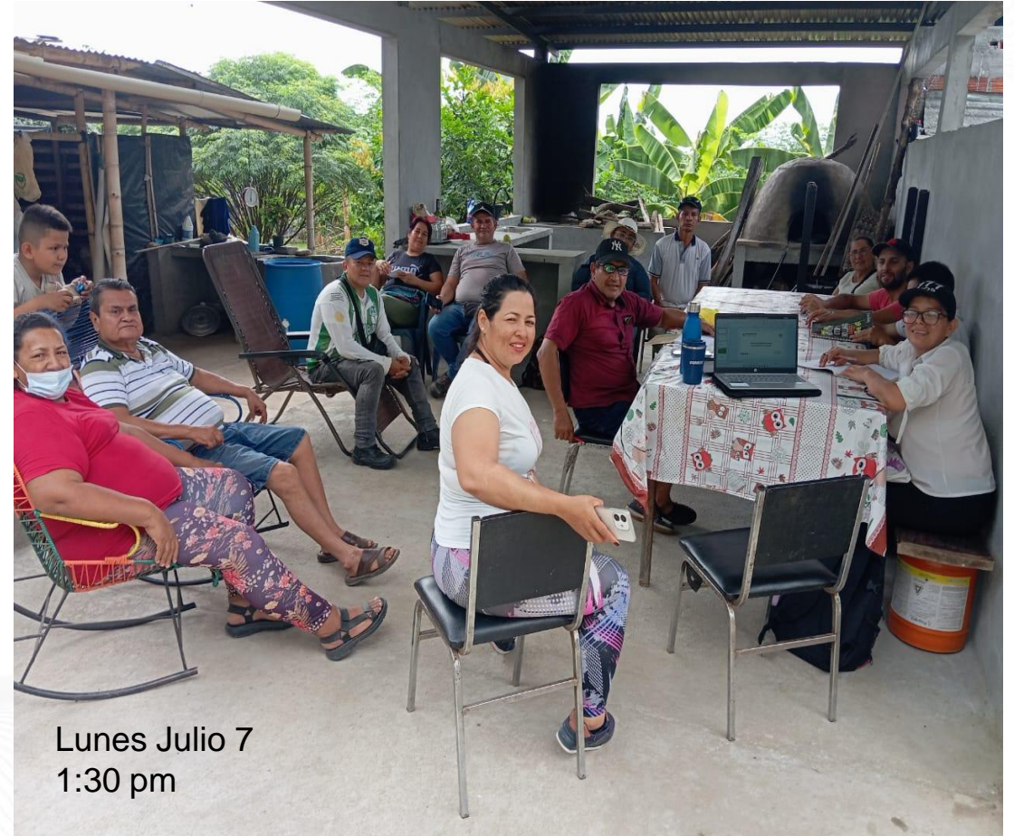
Lunes Julio 7 1:30 pm