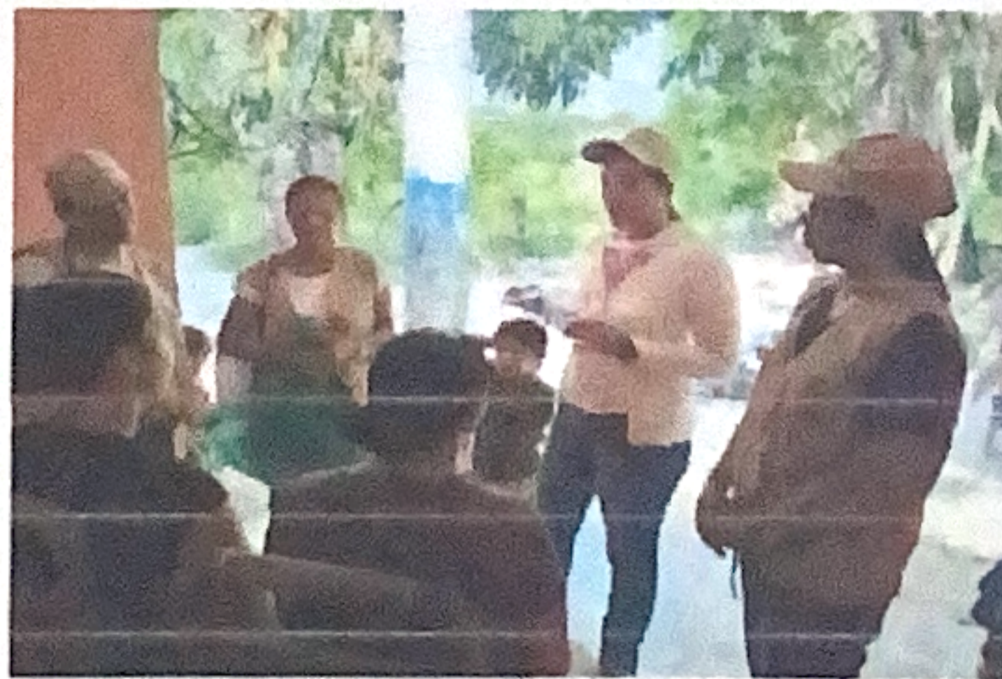
ACOMPAÑAMIENTO JEFE EN TOMA DE MUESTRA DE CITOLOGIA