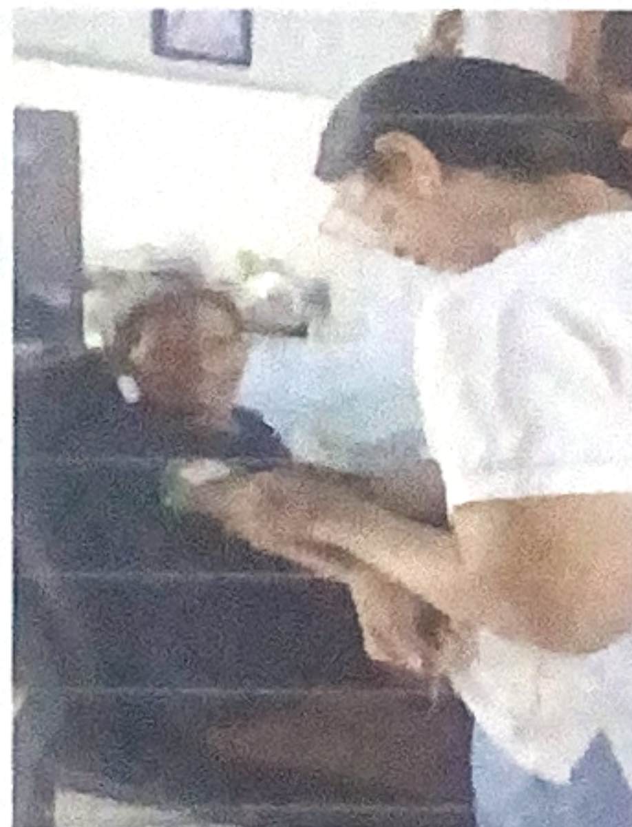
2toma de muestra de laboratorio