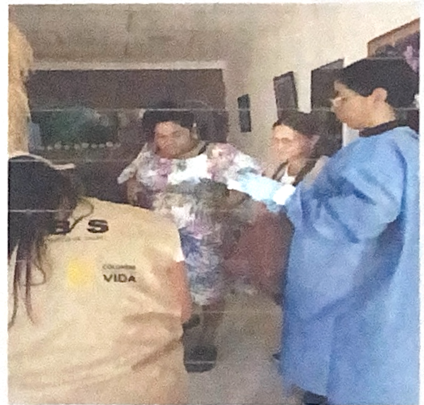
1toma de muestra de citología