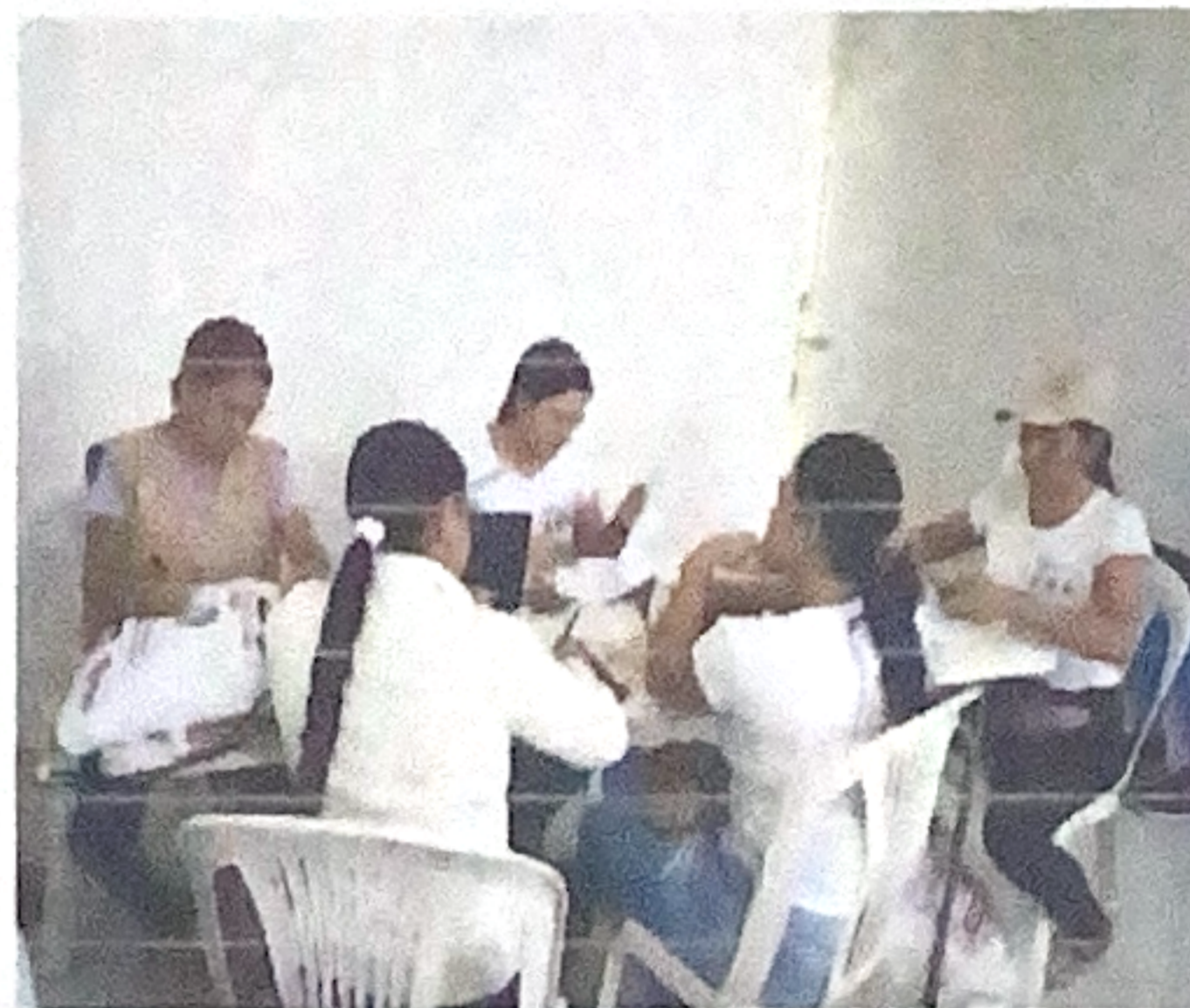
Reunión en la E.S.E hospital de Palmar de Varela para seguimiento y verificación de las caracterizaciones diligenciadas por las auxiliares de enfermería y promotora