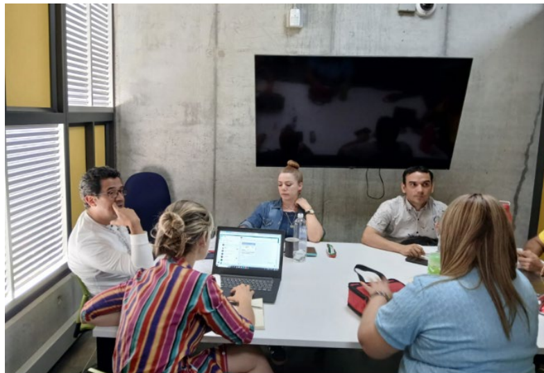
Fotos: de la reunión del 6 de septiembre