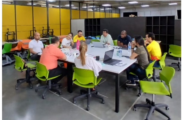
Fotos: Reunión del 9 de septiembre con el Dinamizador SENNOVA