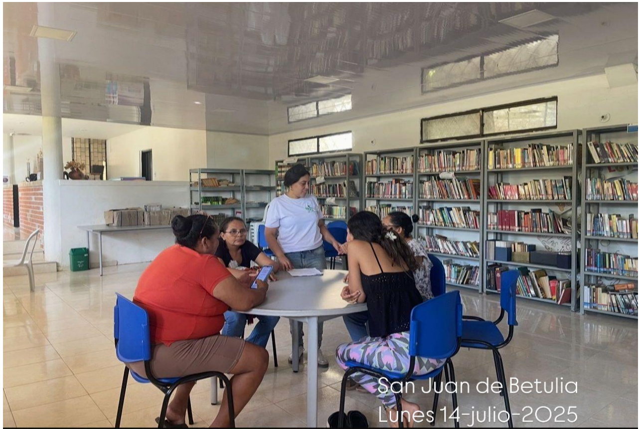
San Juan de Betulia Lunes 14-julio-2025