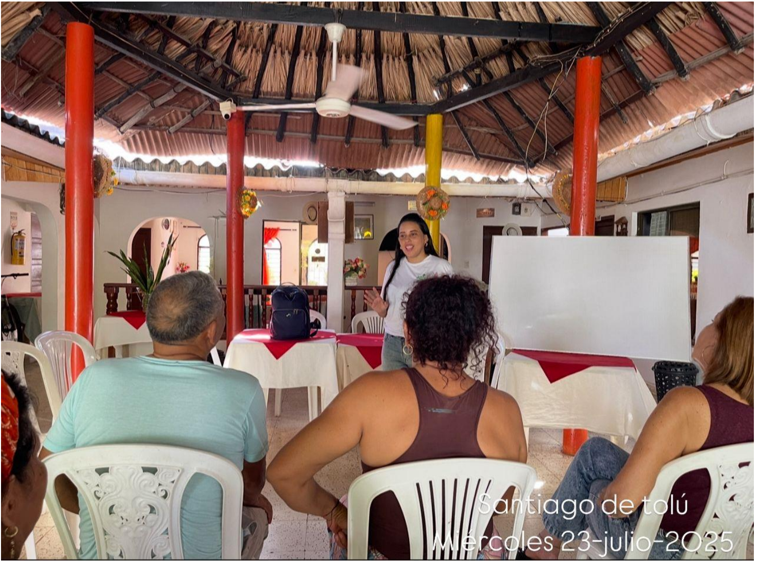
Santiago de tolú Miércoles 23-julio-2025