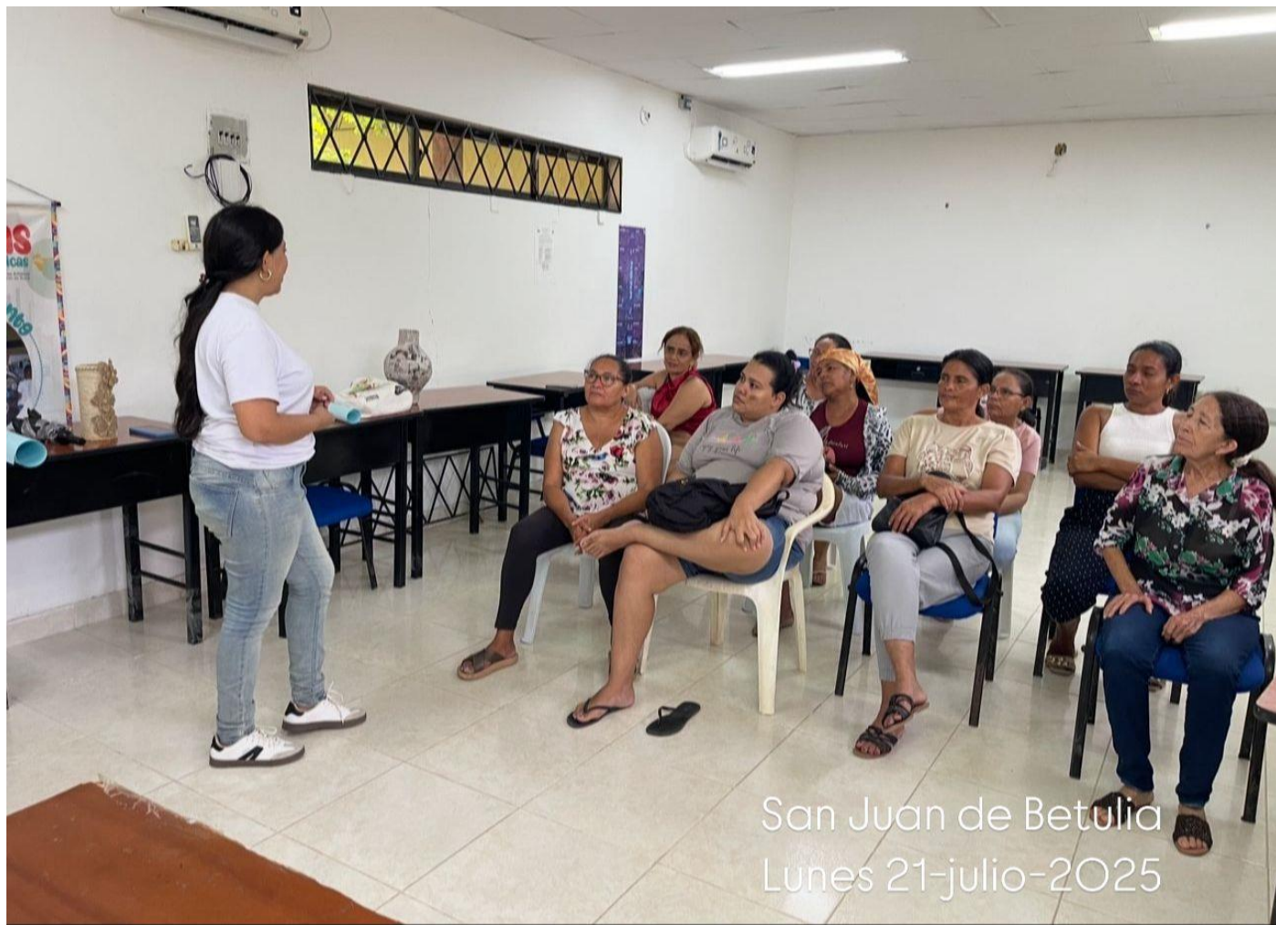
San Juan de Betulia Lunes 21-julio-2025