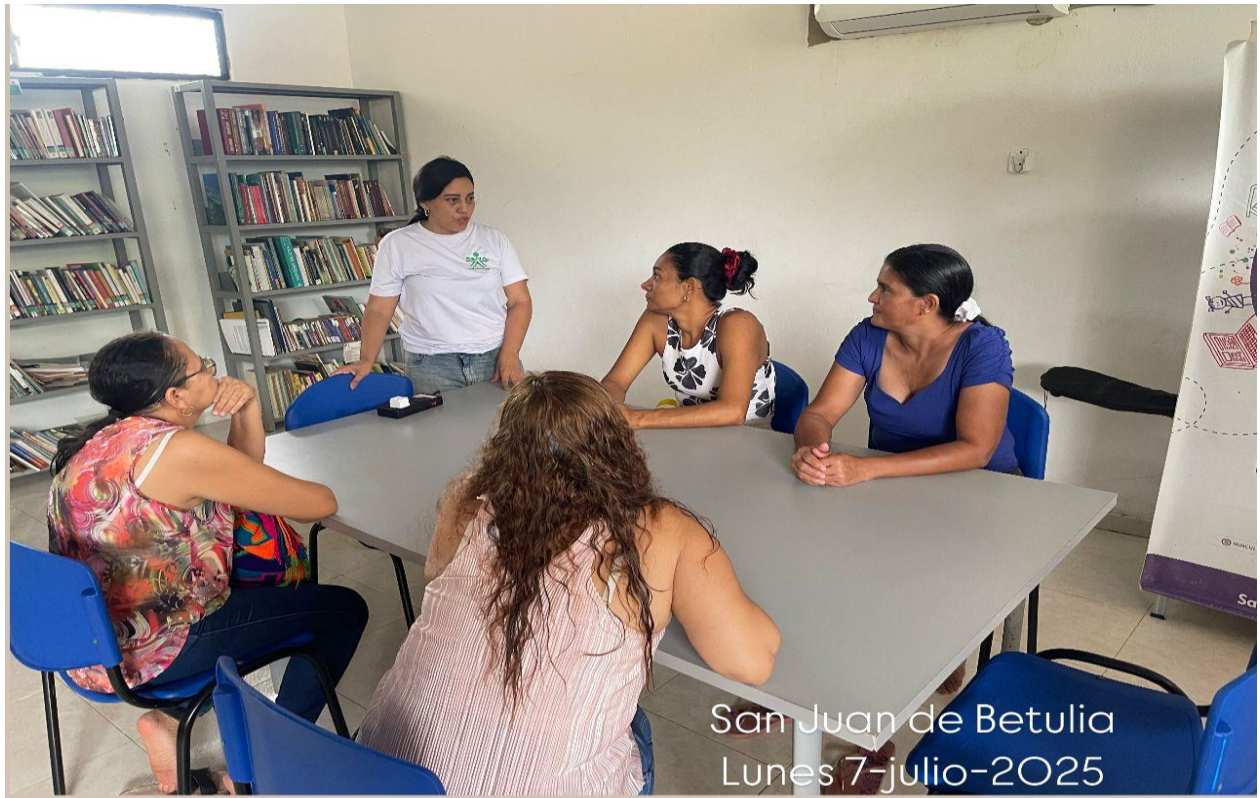
San Juan de Betulia Lunes 7-julio-2025