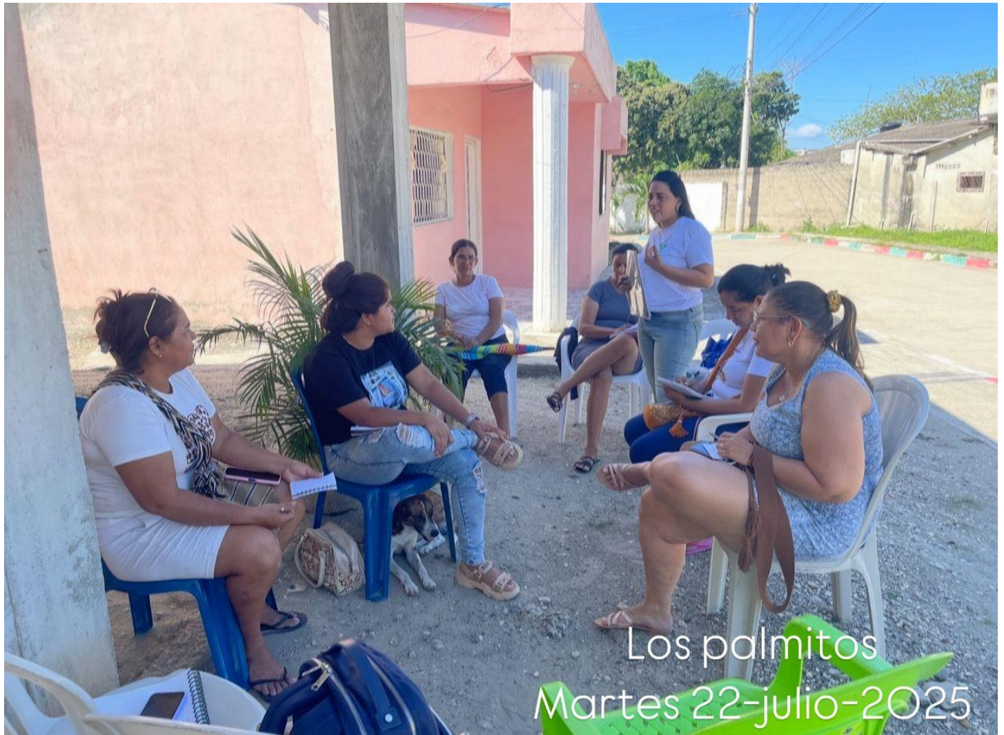
Los palmitos Martes 22-julio-2025