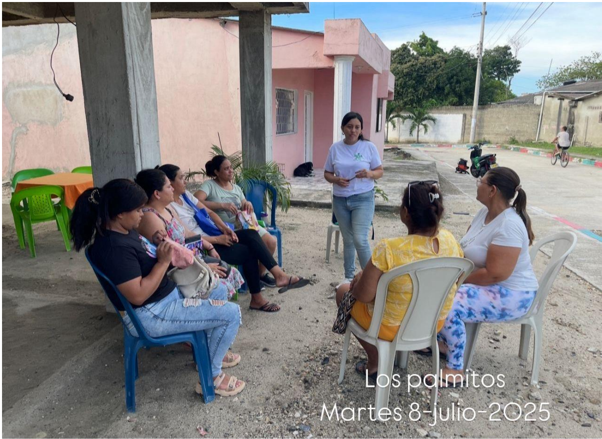
Los palmitos Martes 8-julio-2025