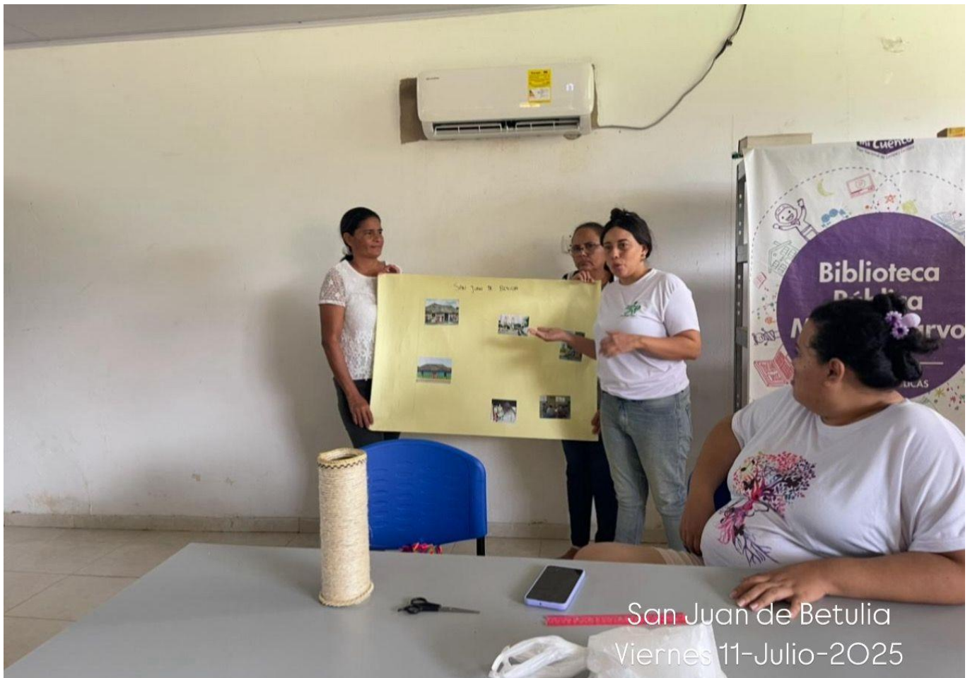
San Juan de Betulia Viernes 11-Julio-2025