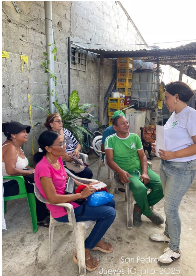
San Pedro Jueves 10-julio-2025