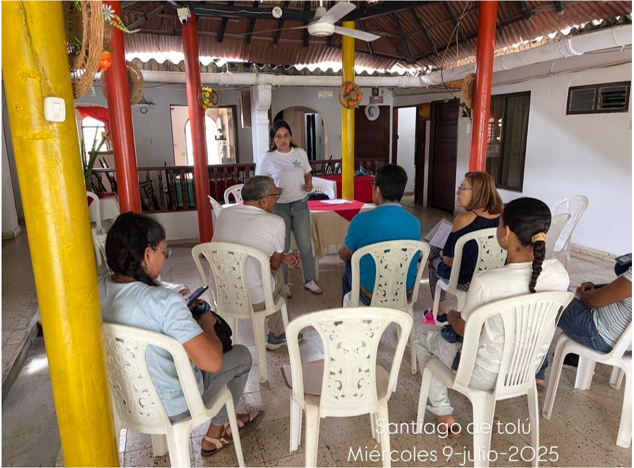
Santiago de tolú Miércoles 9-julio-2025