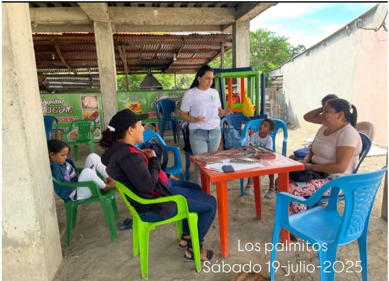
Los palmitos Sábado 19-julio-2025