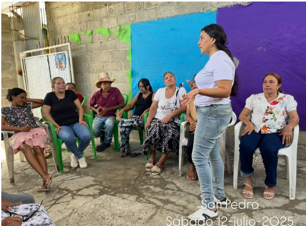
San Pedro Sábado 12-julio-2025