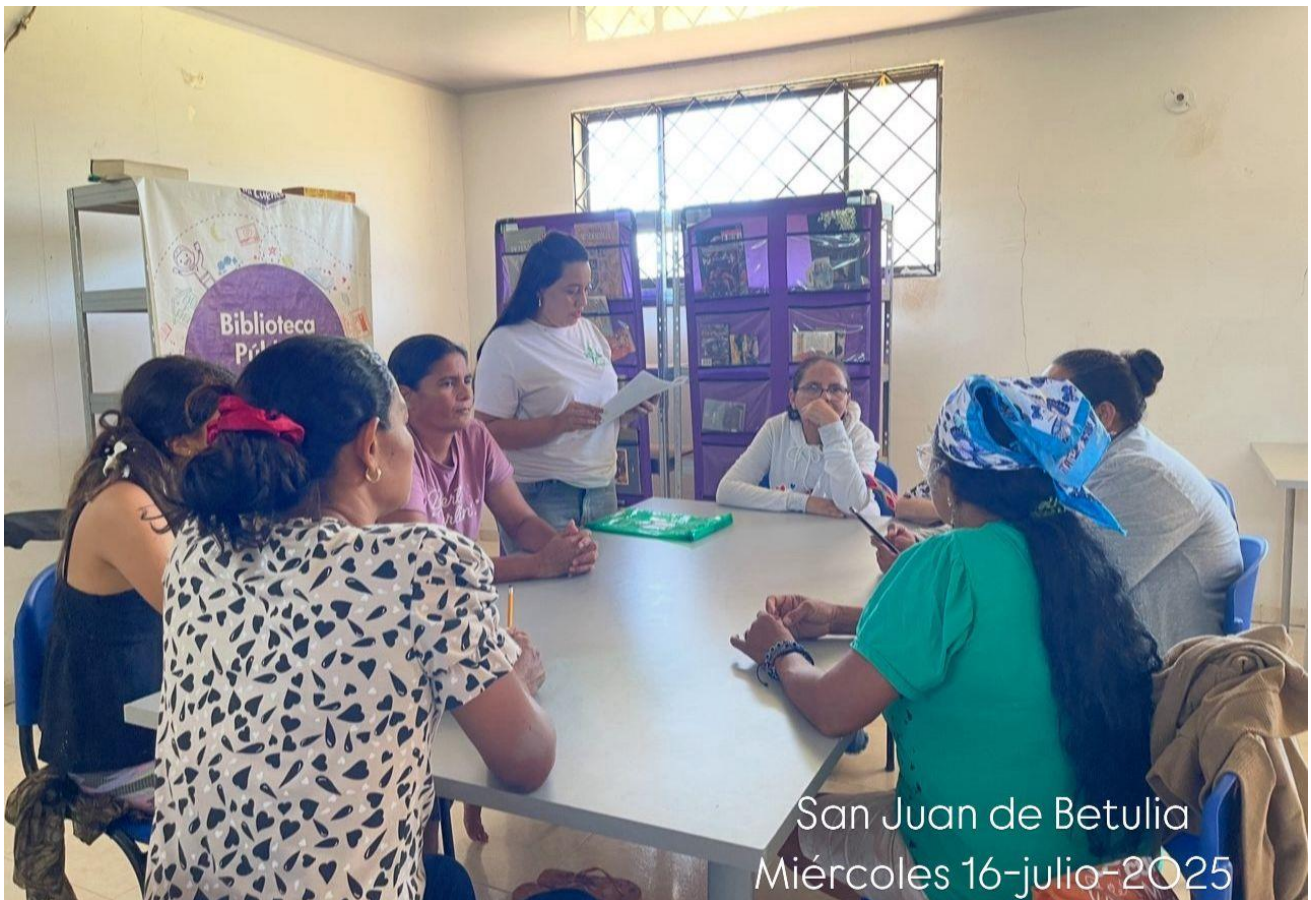
San Juan de Betulia Miércoles 16-julio-2025