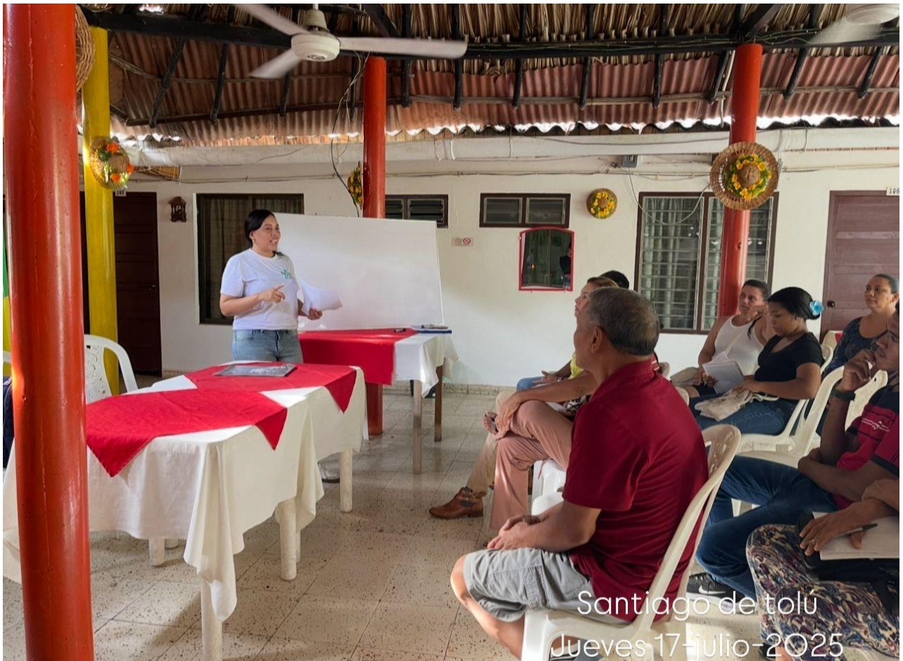
Santiago de tolú Jueves 17-julio-2025