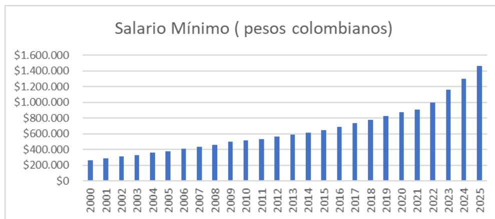
Grafico. Variación histórica del SMMLV en Colombia