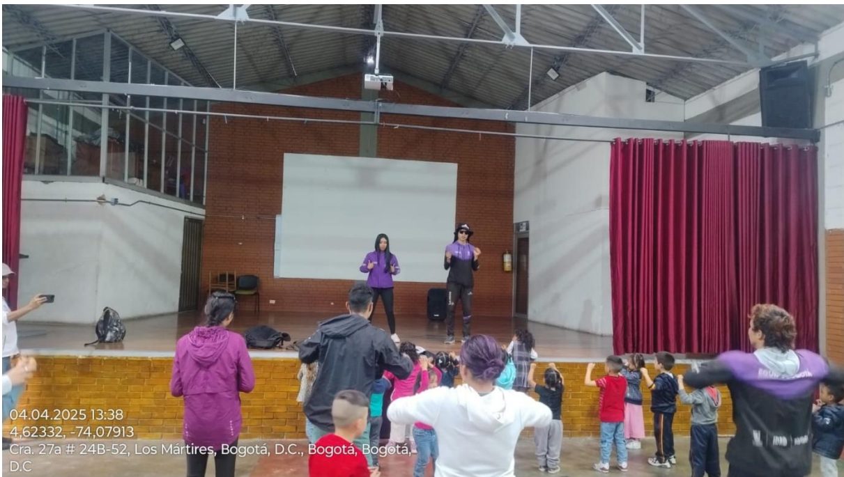
04.04.2025 13:38 4,62332, -74,07913 Cra. 27a # 24B-52, Los Mártires, Bogotá, D.C., Bogotá, Bogotá, D.C.