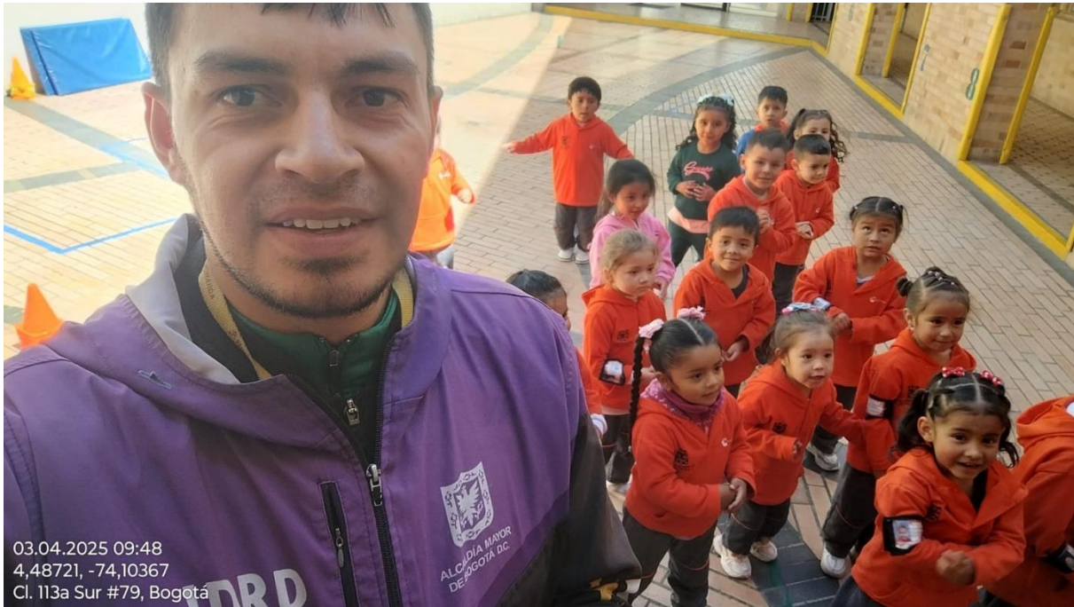
03.04.2025 09:48 4,48721, -74,10367 Cl. 113a Sur #79, Bogotá