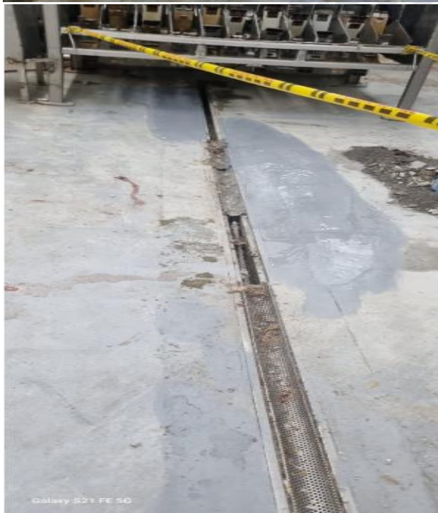
Galaxy S21 FE 5G