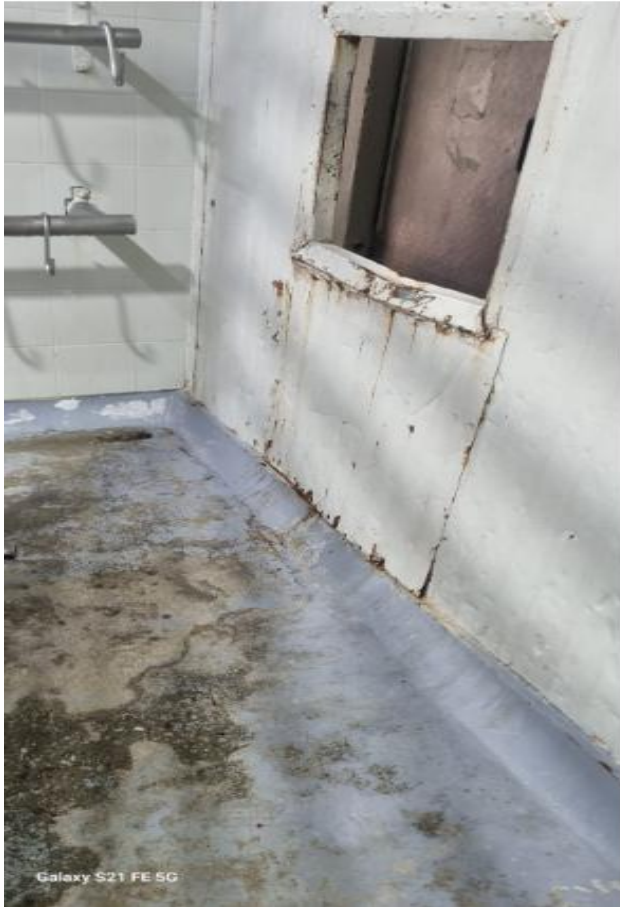
Galaxy S21 FE 5G