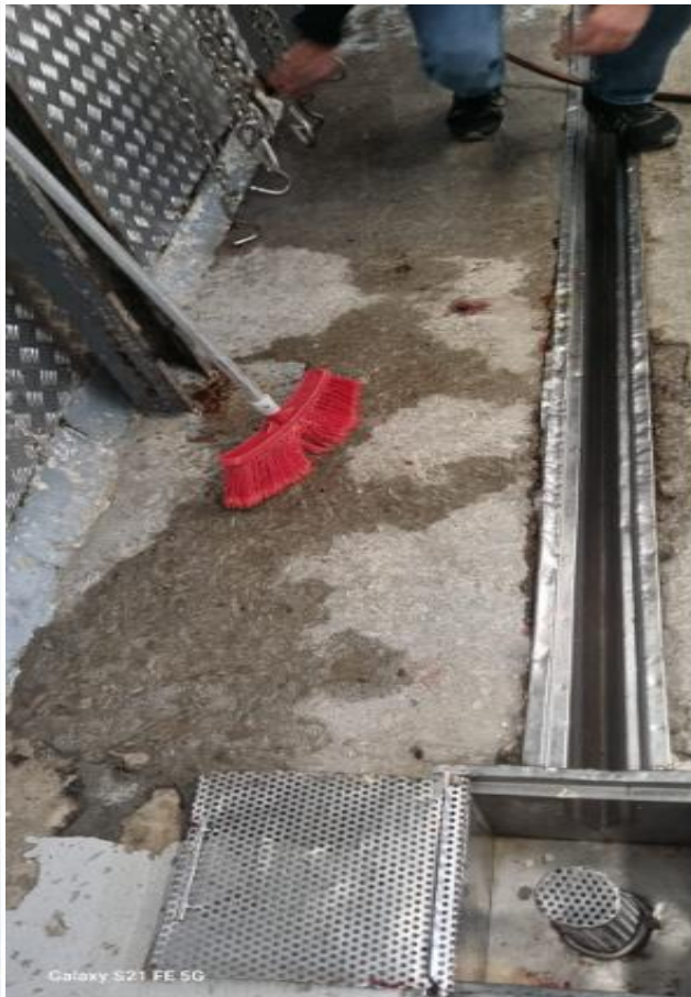
Galaxy S21 FE 5G