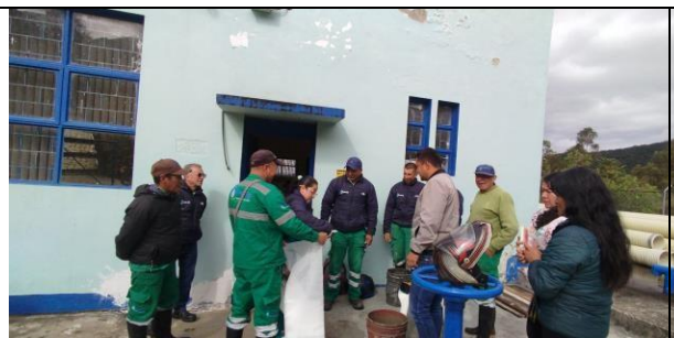
Lugar y fecha: Silvia, 16/06/2025