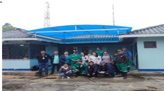
Lugar y fecha: Silvia, 17/06/2025