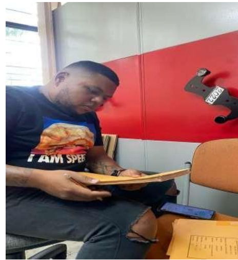
Anexo 5: búsqueda de 18 documentos de archivo del año 2022, correspondientes al proceso de Gestión de Contratación.