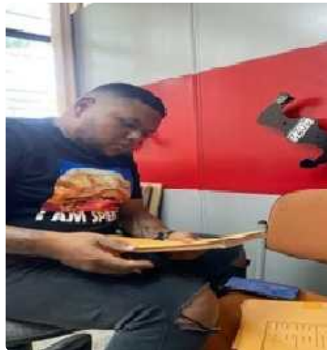
búsqueda de 18 documentos de archivo del año 2022, correspondientes al proceso de Gestión de Contratación

jsbrinez- IP : 186.98.45.170. Fecha : 2025-08-01 14:53:19