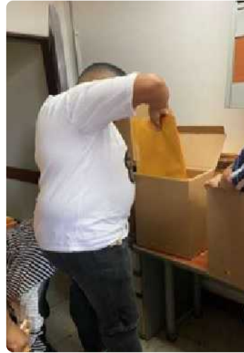
Organización de 148 carpetas del año 2022, correspondientes al proceso de Gestión de Contratación de todas las áreas operativas, ubicadas en el archivo de la sede principal.