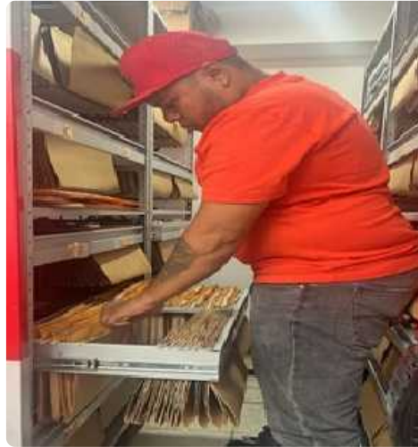
Archivando 20 carpetas que incluyen documentos tales como actas, notificaciones, resoluciones e informes, correspondientes al año 2022 del proceso de Gestión de Contratación