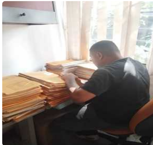
Clasificación, organización, expurgo y foliación de todas las carpetas del año 2022 del proceso de Gestión de Contratación de todas las Áreas Operativas, obteniendo 7.100 folios.