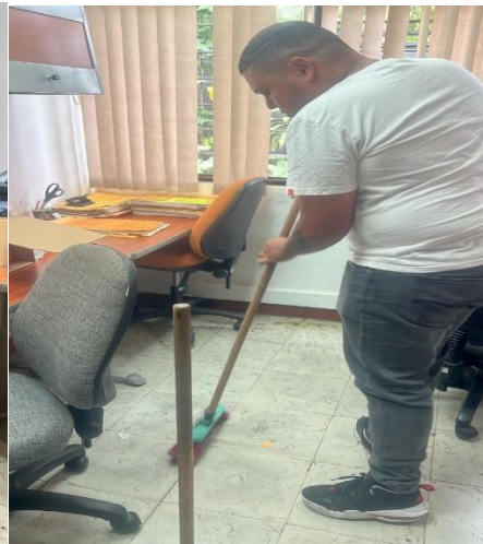
Anexo 6: cuidado de los archivos, asegurando que se mantuvieran en condiciones adecuadas de conservación, almacenamiento y limpieza.