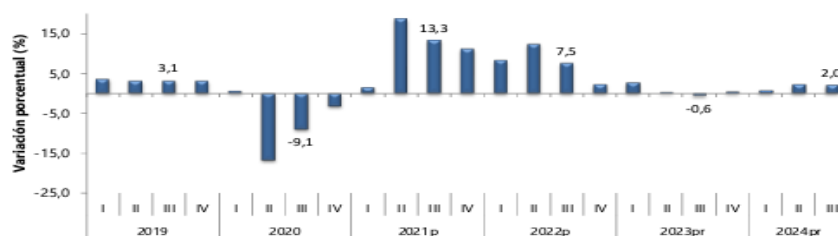
Gráfico 1. Producto Interno Bruto Tasa de crecimiento en volumen 1 2019-I / 2024 pr -III

En el tercer trimestre de 2024pr, el Producto Interno Bruto en su serie original, crece 2,0% respecto al mismo periodo de 2023pr