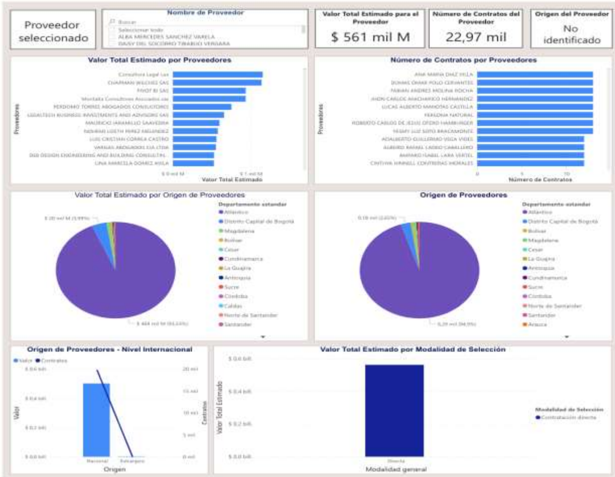
Fuente: Modelo de Abastecimiento - Análisis de la demanda Colombia compra eficiente