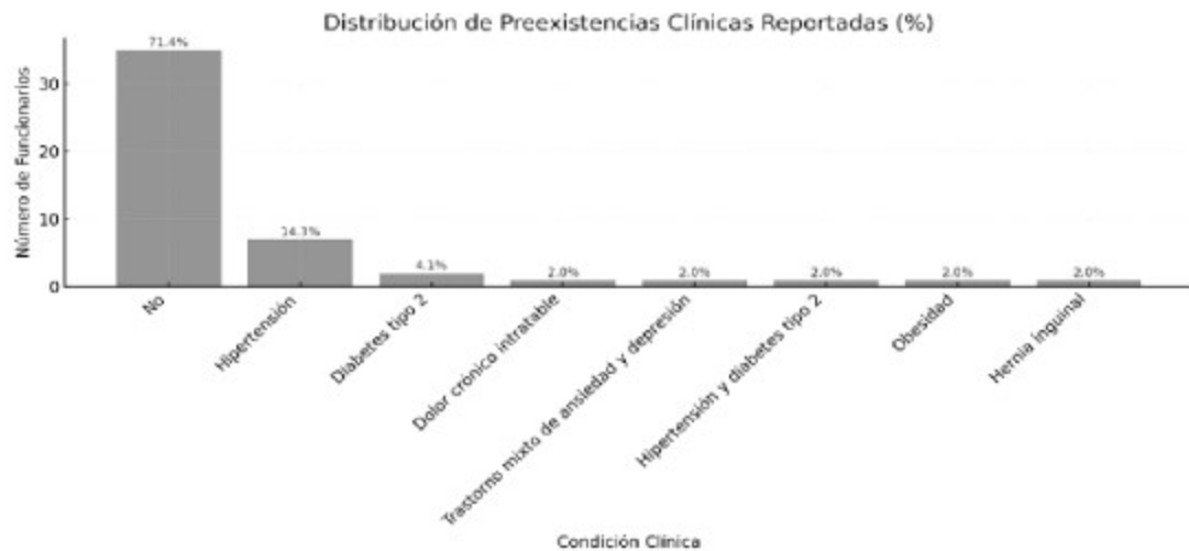
Imagen No. 5.