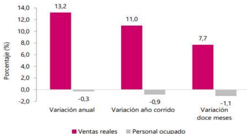
Gráfico 1. Variación anual, año corrido y doce meses de las ventas reales y el personal ocupado* Total nacional Mayo 2025 Pr