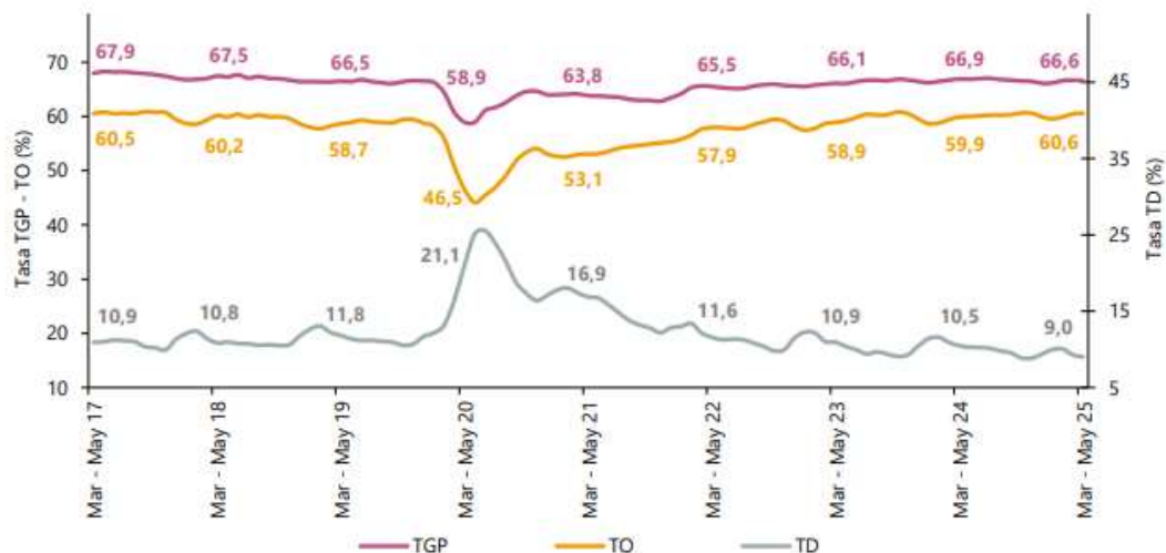
Gráfico 5. Tasa global de participación (TGP), Tasa de ocupación (TO) y Tasa de desocupación (TD) Total 13 ciudades y áreas metropolitanas Marzo - mayo (2017 - 2025)

En el trimestre móvil marzo - mayo 2025, la tasa de desocupación de las 13 ciudades y áreas metropolitanas fue 9,0%, lo que representó una disminución de 1,5 puntos porcentuales respecto al trimestre móvil marzo - mayo 2024 (10,5%). La tasa global de participación se ubicó en 66,6% y la tasa de ocupación en 60,6%, mientras que en el mismo periodo del año anterior estas tasas fueron 66,9% y 59,9%, respectivamente.