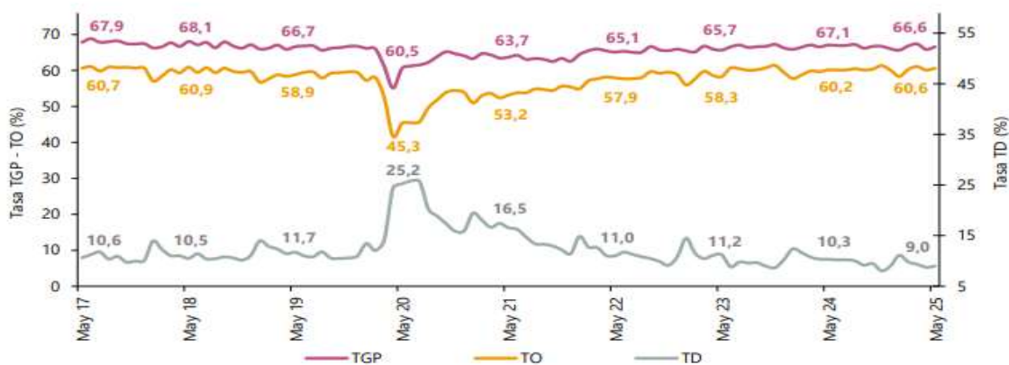
Gráfico 3. Tasa global de participación (TGP), Tasa de ocupación (TO) y Tasa de desocupación (TD) Total 13 ciudades y áreas metropolitanas Mayo (2017 - 2025)

En mayo de 2025, la tasa de desocupación en el total de las 13 ciudades y áreas metropolitanas fue 9,0%, lo que representó una disminución de 1,3 puntos porcentuales respecto al mismo mes de 2024 (10,3%). La tasa global de participación se ubicó en 66,6% y la tasa de ocupación en 60,6%, mientras que en mayo de 2024 estas tasas fueron 67,1% y 60,2%, respectivamente.