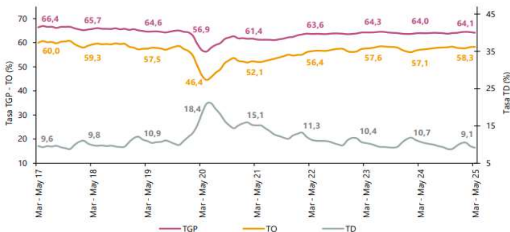
Gráfico 4. Tasa global de participación (TGP), Tasa de ocupación (TO) y Tasa de desocupación (TD) Total nacional Marzo - mayo (2017 - 2025)