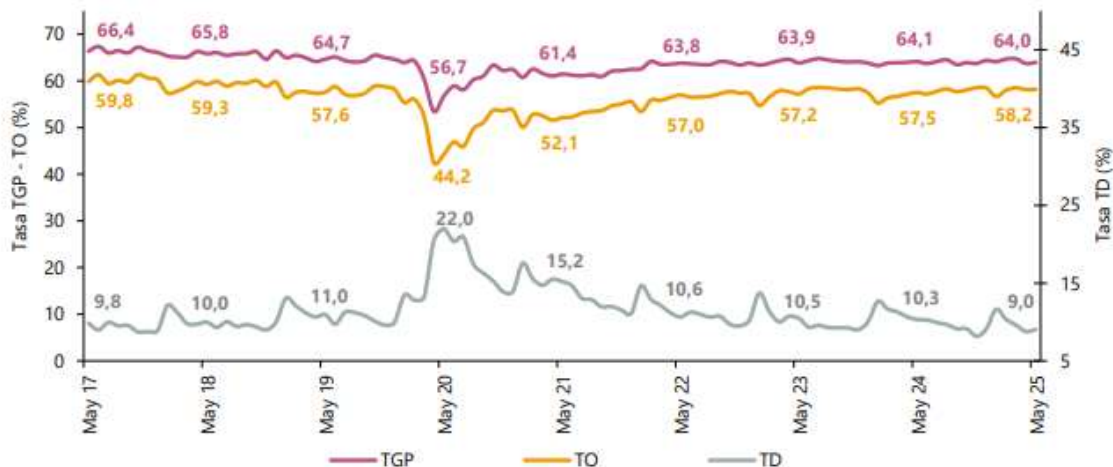
Gráfico 1. Tasa global de participación (TGP), Tasa de ocupación (TO) y Tasa de desocupación (TD) Total nacional Mayo (2017 - 2025)

Fuente: DANE, Gran Encuesta Integrada de Hogares (GEIH).