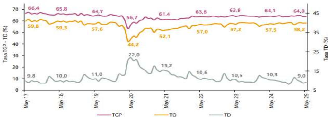
Gráfico 2. Tasa global de participación (TGP), Tasa de ocupación (TO) y Tasa de desocupación (TD) Total nacional Mayo (2017 - 2025)

Para el mes de mayo de 2025, la tasa de desocupación del total nacional fue 9,0%, lo que representó una disminución de 1,3 puntos porcentuales respecto al mismo mes de 2024 (10,3%). La tasa global de participación se ubicó en 64,0% y la tasa de ocupación en 58,2%, mientras que en mayo de 2024 estas tasas fueron 64,1% y 57,5%, respectivamente.