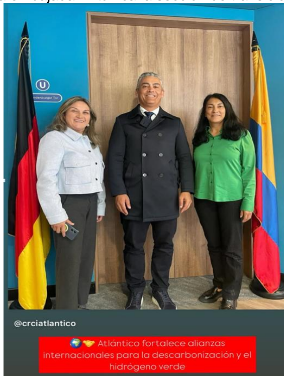
Reunión con la cámara colombo Alemana