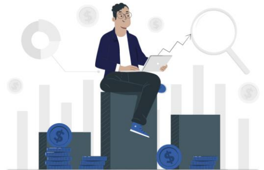
Gestión de activos CMDB