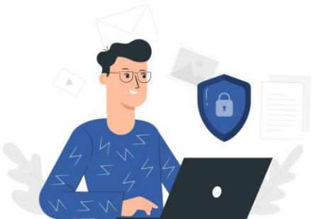
Prevención de la Fuga de Información