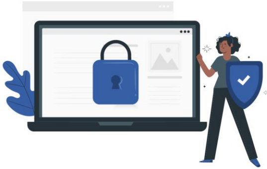
Soluciones de seguridad informática

ColCiber su aliado en la gestión TI de su empresa