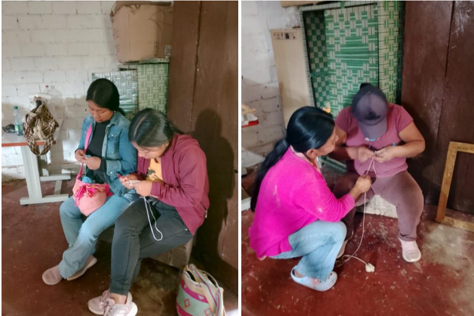
Ilustración 4. FICHA 3268504 TOTORO Actividad: montaje de hilos para telar vertical