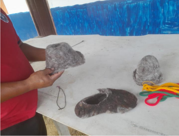
Ilustración 4 FICHA 3232572

Actividad. Presentación de productos afieltrados (aglomeración de fibras de lana para dar un producto sin tejer)