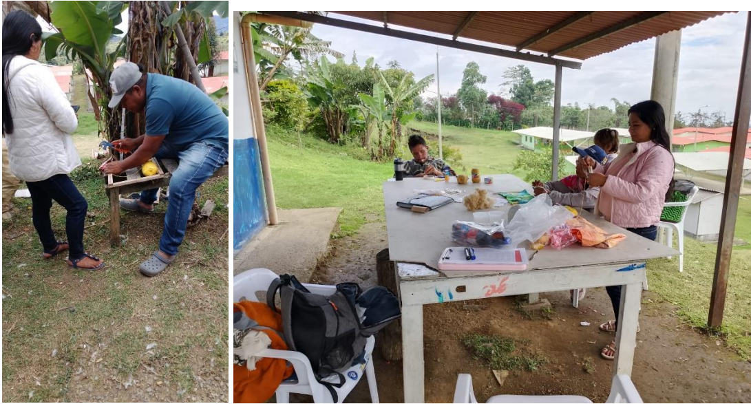
Ilustración 6 FICHA 3232572 CALDONO

Actividad: alistamiento de materiales para tejer en telar vertical