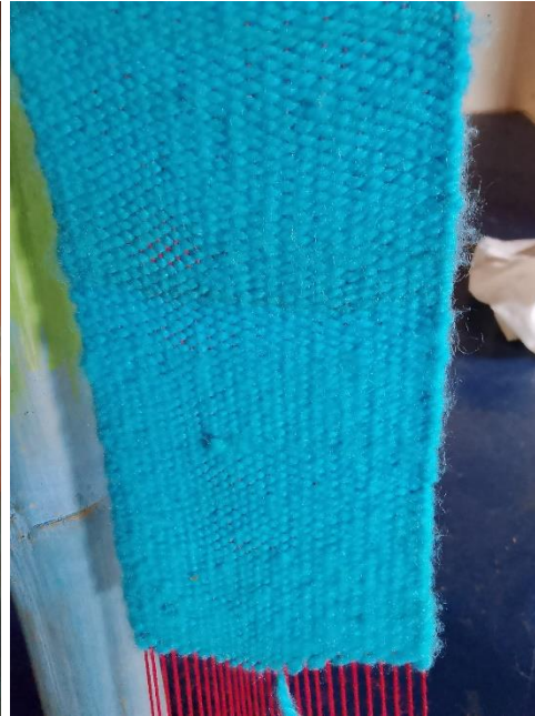
Elaboración de bufanda tejida