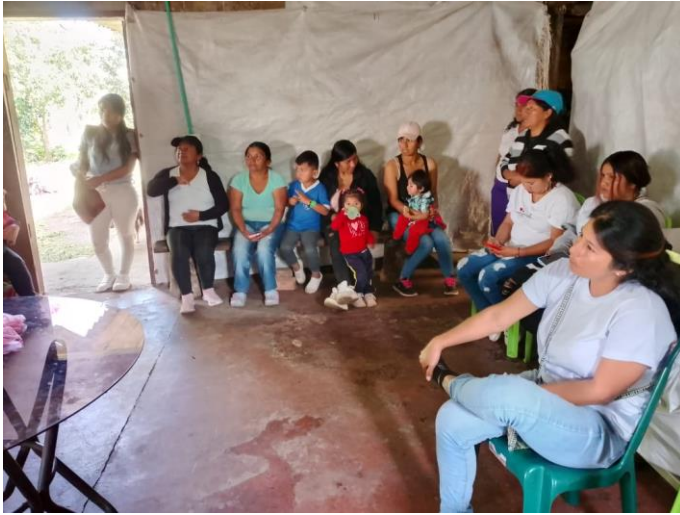
Ilustración 2. FICHA 3268504 TOTORO

Actividad: Socialización y Concertación de horario de la formación Emprendedor en elaboración de artesanías étnicas