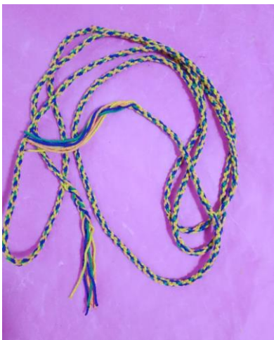
cordón elaborado en telar circular