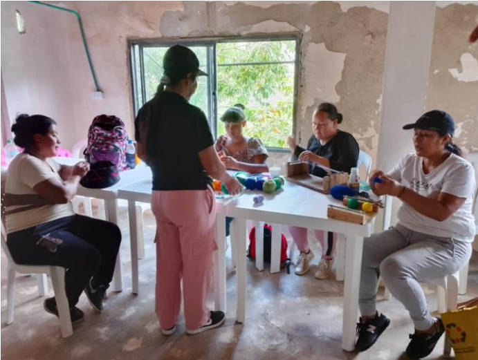
Ilustración 2. Ficha 3233902

Actividad: taller de fichas técnicas de productos