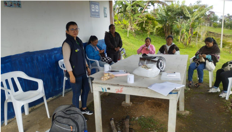
Ilustración 2. Ficha 3232572 CALDONO

Actividad: taller de determinantes de calidad de los productos