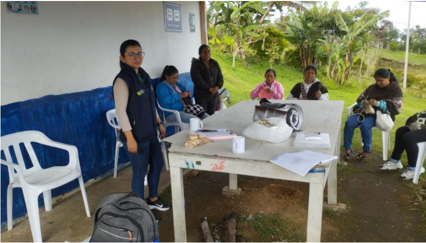
Ilustración 2. Ficha 3232572 CALDONO

Actividad: taller de elaboración de ficha técnica de producto