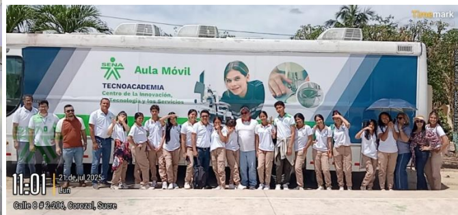
Aula Movil - IETA Don Alonso – Corozal Sucre – 21/07/2025