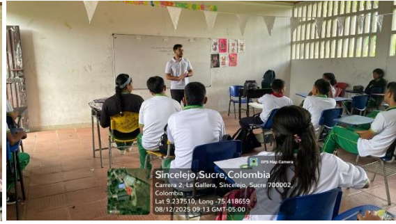
Ejecución de la Formación – Diseño y Modelado 3D – IETA La Gallera – Sincelajo Sucre – 12/08/2025