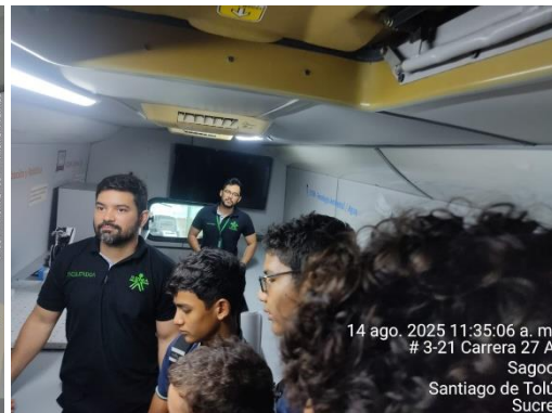
Aula Móvil – IETA PIO XII – Coveñas Sucre – 14/08/2025