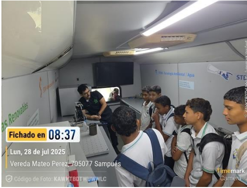
Aula móvil- IE San Mateo- Sampues Sucre – 28/07/2025