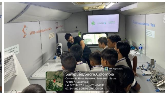
Aula Movil – IEITA de Escobar Arriba Sede Villa Nueva – 24/07/2025