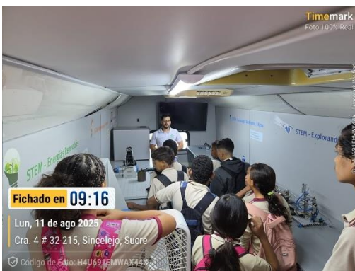
Aula Móvil - IE Rafael Núñez – Sincelejo Sucre - 11/08/2025