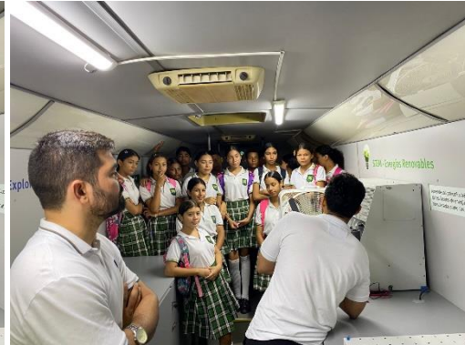
Aula Móvil - IETA el piñal - Piñal Sucre - 17/07/2025