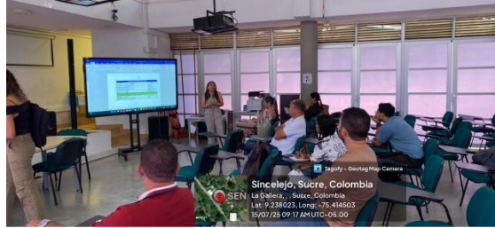
Reunión Seguimiento a la Formación – 15/07/2025