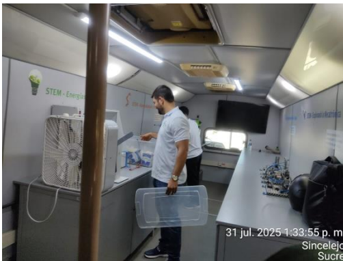
Aula Movil – IE Rogelio Rodriguez Severiche - Sincelejo Sucre – 31/07/2025