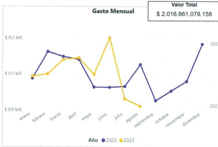
Gráfico N°2 Valor Contratación Total 2022 2023 CCE

Fuente: Modelo de Abastecimiento Estratégico para la compra pública CCE