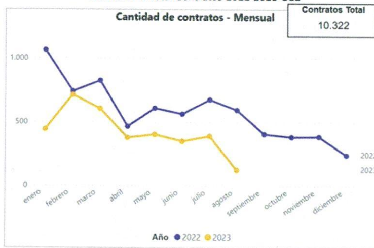
Gráfico N°3 Total Contratos 2022 2023 CCE

Fuente: Modelo de Abastecimiento Estratégico para la compra pública CCE