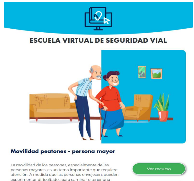
Escuela virtual de seguridad vial – ANSV “Movilidad patones: Persona mayor”