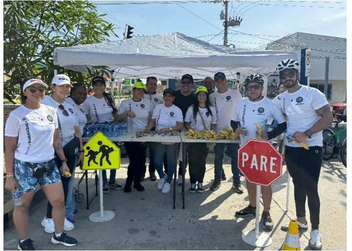
Actividad Biquilla – Secretaría de Tránsito y Seguridad Vial