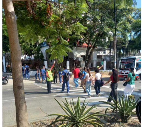
Actividad de Sensibilización – Universidad Simón Bolívar