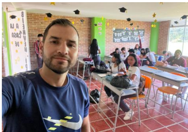
Colegio Rufino Cuervo grado 10° 6 agosto y 13 agosto de 2025 desarrollo guías 6 y 7 ejecución de eventos deportivos y recreativos.