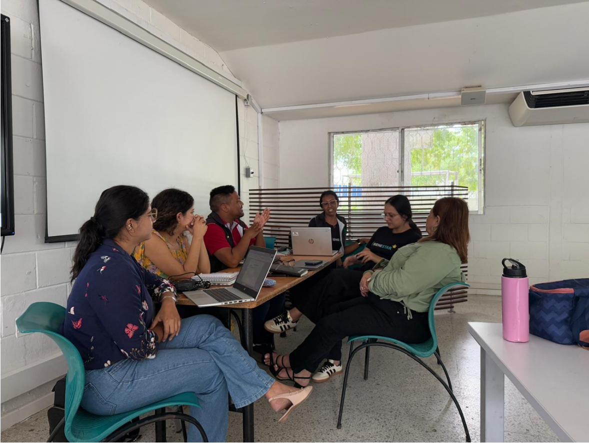
REUNION DE EQUIPO DE BIENESTAR AL APRENDIZ