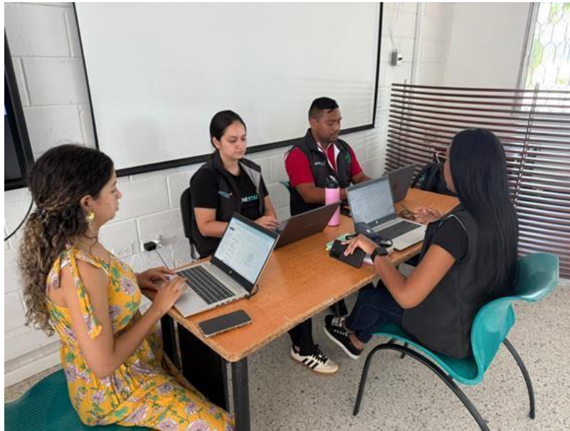
Reunión del equipo de bienestar al aprendiz para planeación y evaluación de actividades III trimestre académico.