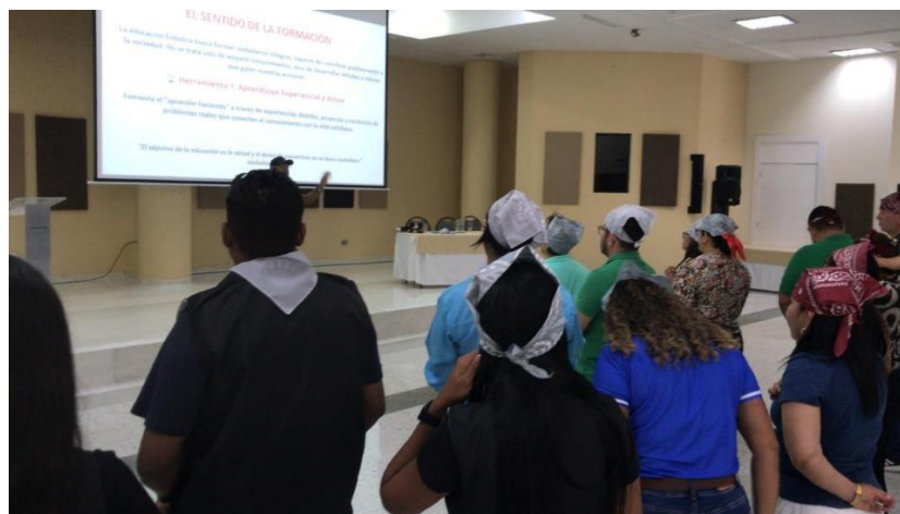
Jornada de alistamiento III Trimestre; seminario con Coach de liderazgo con el fin de mejorar la calidad del servicio que se le presta a los aprendices.