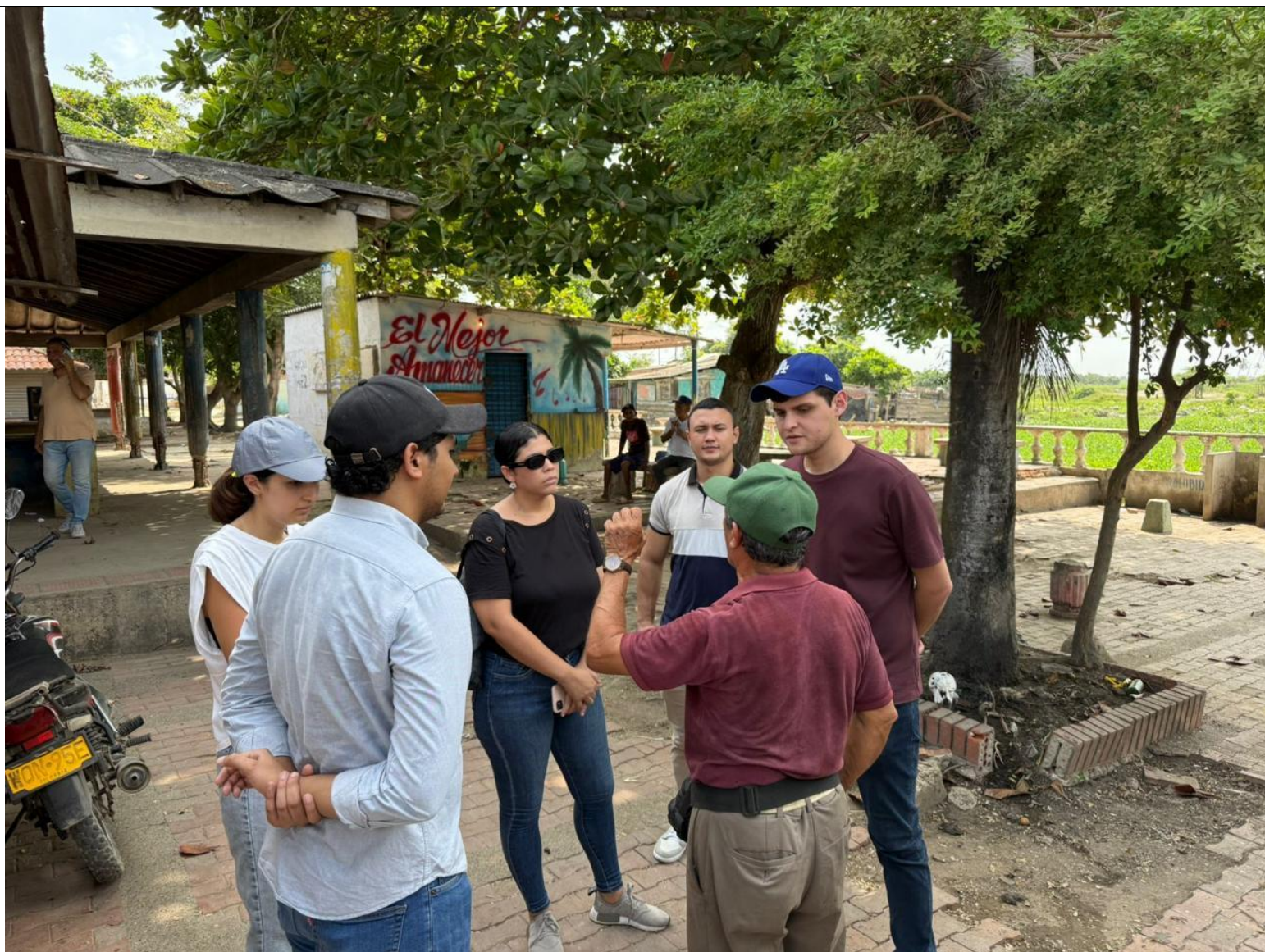
Recorrido con Gobernación del Atlántico, Proyecto Plaza de Mercado Soledad (24 de julio 2025)