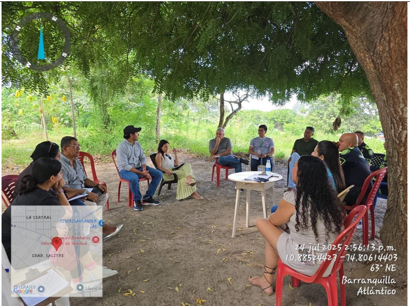
Reunión con comunidad de Ciudad Salitre 24 de julio de 2025