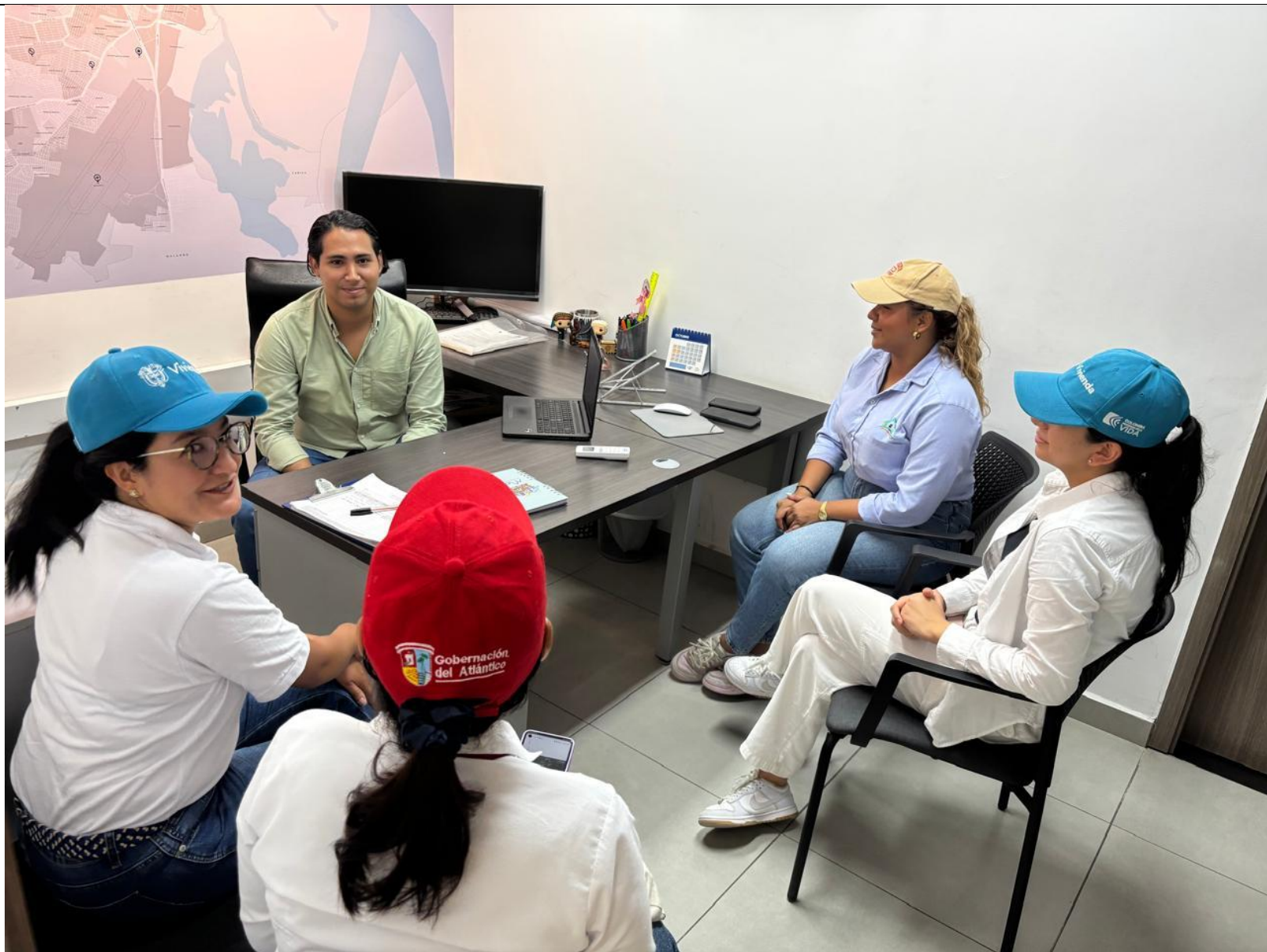
Reunión Ministerio de Vivienda Programa de Conexiones intradomiciliarias 29 de julio de 2025