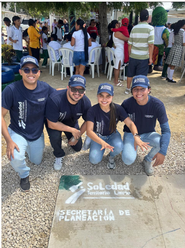
Atención a jornada de embellecimiento en el barrio Villa Stefany en el marco del programa #SoledadTerritorioLimpio (07 de agosto).