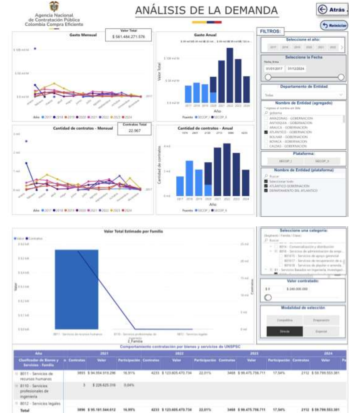
Gráfica. Comportamiento de la contratación por bienes y servicios según la clasificación UNSPSC