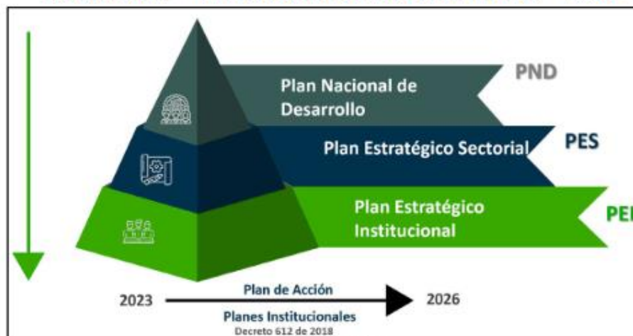
Ilustración 2 Alineación normativa PEI 2023 – 2026

Conforme a los lineamientos del Plan de Acción 2023-2026, Sembrando el Cambio: Por la inclusión, la sostenibilidad, y la seguridad humana; se propone realizar esfuerzos orientados a garantizar que todas las acciones y recursos de la entidad estén alineados al plan estratégico institucional 2023 – 2026 y enfocados en atender su propósito fundamental. Por consiguiente, corresponde a la Dirección General de manera conjunta con las Direcciones Regionales y Centros de Formación llevar a cabo actuaciones encaminadas al cumplimiento de los objetivos. Todas las actuaciones que se llevarán a cabo para los propósitos del Plan de Acción, están soportadas en las Bases del Plan Nacional de Desarrollo PND 2022-2026 Colombia Potencia Mundial de la vida, con sus correspondientes pilares, transformaciones e implicaciones: