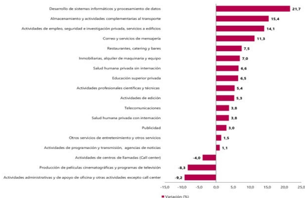
Gráfico 1. Variación anual de los ingresos nominales, según subsector de servicios Total nacional Junio 2025 P / junio 2024