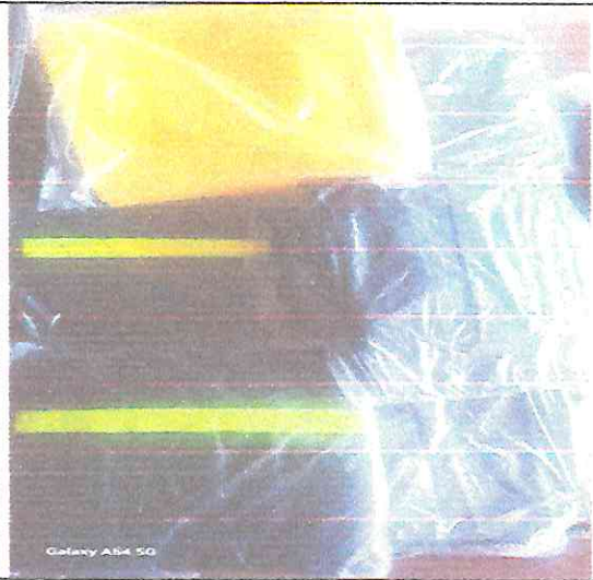
Galaxy A54 5G