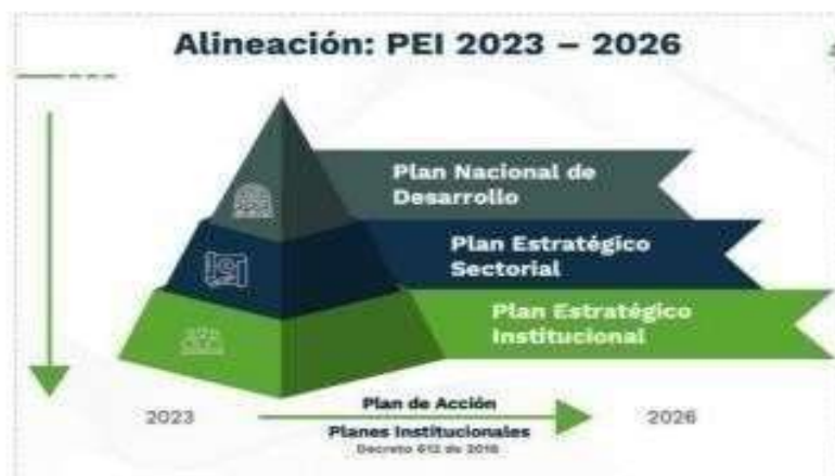
Ilustración 2 Alineación normativa PEI 2023 – 2026

El Plan Estratégico Institucional – PEI 2023–2026 SENA SEMBRANDO EL CAMBIO; POR LA INCLUSIÓN, LA SOSTENIBILIDAD Y LA SEGURIDAD HUMANA, tiene como puesta fundamental el campesinado del país; su accionar estará orientado a propiciar el reconocimiento de la población campesina en la vida social, cultural y económica del país con líneas de acción transversales para atender a esta población y generar capacidades para la articulación y consolidación de modelos asociativos campesinos. Para lograrlo ha formulado la estrategia CAMPESENA, cuya finalidad es contribuir a la soberanía alimentaria del país y a la calidad de la vida de la población campesina, mediante la transformación productiva y sostenible de la economía aportando al logro de la paz total y la justicia social.