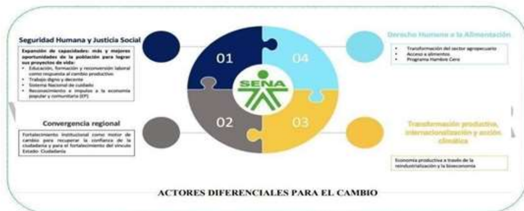
Ilustración 4 Alineación con Plan Nacional de Desarrollo 2022 – 2026

El SENA por su misionalidad y presencia a nivel nacional tiene relación con todas las transformaciones; sin embargo, su alineación principal está con la transformación de Seguridad Humana y Justicia Social, seguidas por las transformaciones de Seguridad Alimentaria, Transformación Productiva y la Convergencia Regional, conectadas a los actores diferenciales del cambio.