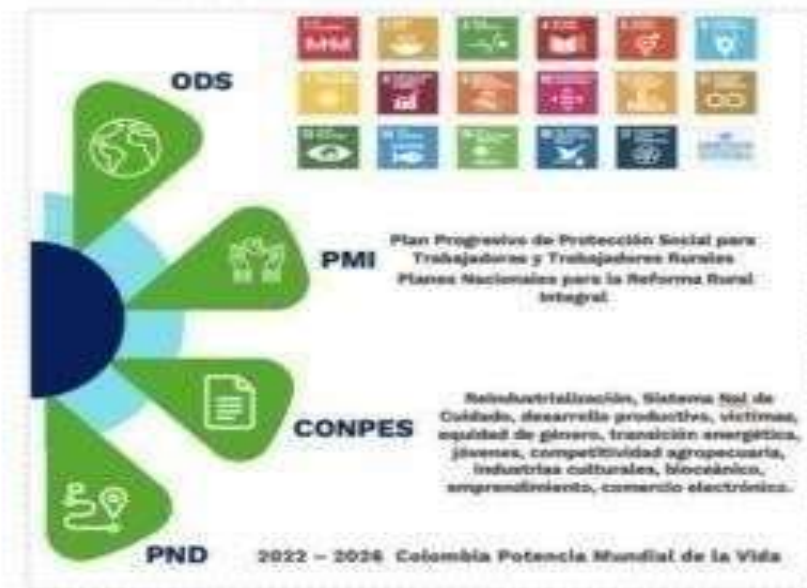
Ilustración 3 Alineación estratégica institucional

El SENA por su misionalidad y presencia a nivel nacional tiene relación con todas las transformaciones; sin embargo, su alineación principal está con la transformación de Seguridad Humana y Justicia Social, seguidas por las transformaciones de Seguridad Alimentaria, Transformación Productiva y la Convergencia Regional, conectadas a los actores diferenciales del cambio.