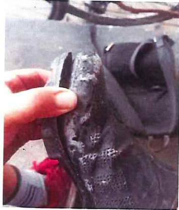
Anexo actividad 10