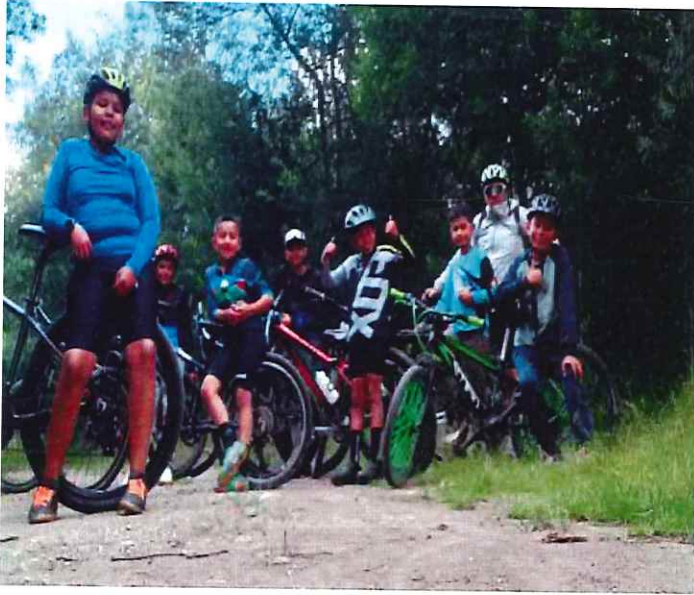
Anexo actividad 1