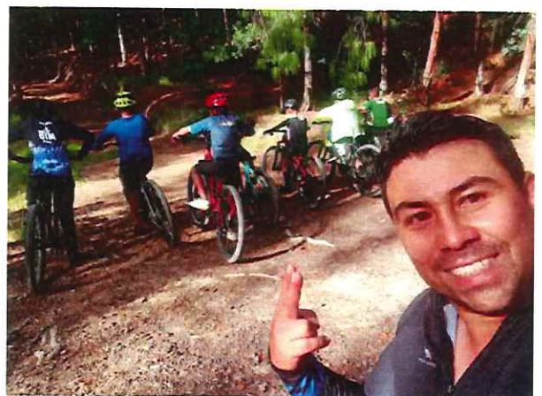
Anexo actividad 8