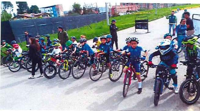
Anexo actividad 3.