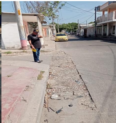
Entre las vías a intervenir