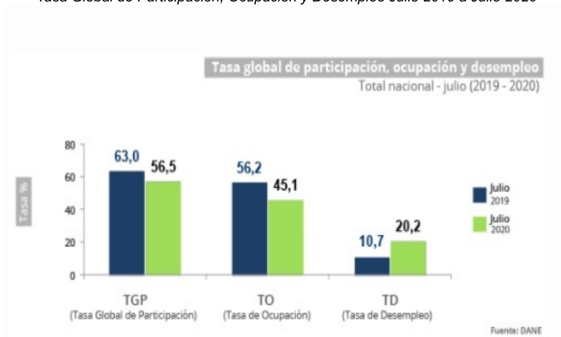
Gráfica 3 Tasa Global de Participación, Ocupación y Desempleo Julio 2019 a Julio 2020

Así mismo, el 43,0% de la población ocupada del país manifestó que tuvo una reducción de la actividad económica y de ingresos; el 23,4% sostuvo que no había podido realizar pagos de facturas y deudas. Al 30,8% de la población ocupada del país no se le presentaron dificultades 7 .