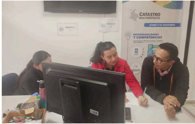
Ilustración 1. Registro Fotográfico, reunión.

- Asistí y participé en la reunión convocada por el supervisor del contrato: Lunes 08 de septiembre, seguimiento de la atención al Usuario.