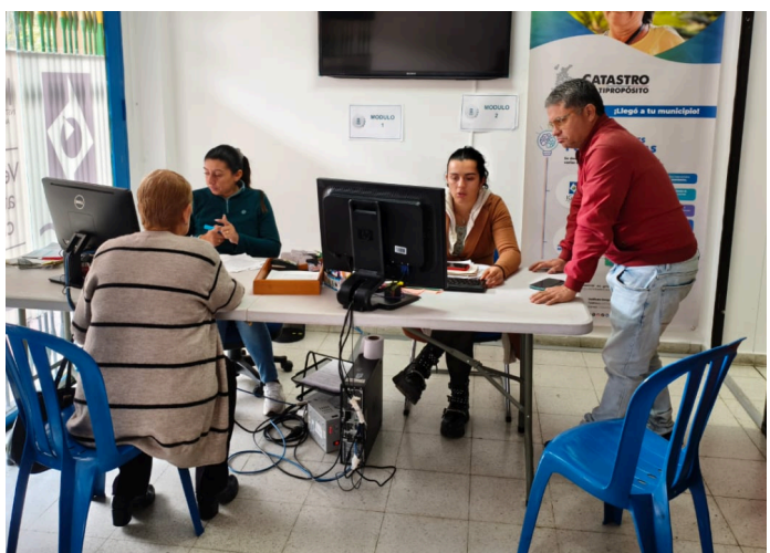
Ilustración 3. Registro Fotográfico.

-Cada día laborado, se registró en el formulario virtual de la ventanilla, los datos de las 107 personas atendidas, cada vez que fueron recibidas. Este formulario, permite llevar el registro de las personas atendidas, en este mes se registró en total 193 .