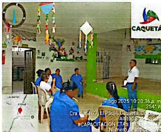
Evidencia 1. Capacitación sobre Inocuidad de los Alimentos Al Talento Humano del Hogar Infantil, 21 de julio, El Paujil