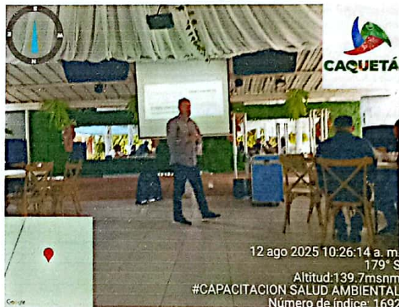
Evidencia 1. Reunión Salud Ambiental, 12 de agosto, Casa Club La Bacanisima