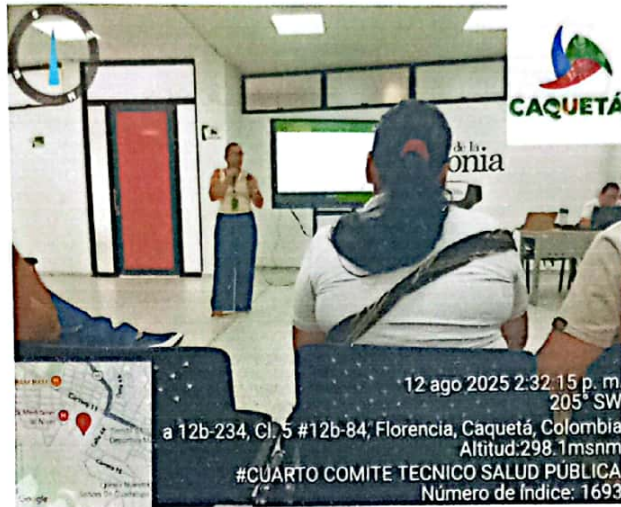
Evidencia 2. Cuarto Comité Técnico 12 de agosto, Sala 7 Piso 4 de la Universidad de la Amazonia

Producto 8. Informe ejecutivo con los respectivos soportes (pantallazo de cargue quincenal y archivo plano en EXCEL)