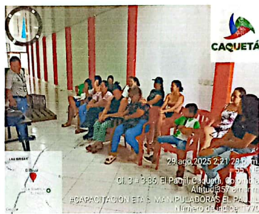
Evidencia 2. ETAs Enfermedades Transmitidas por Alimentos Manipuladoras Programa PAE, 29 de agosto, El Paujil.