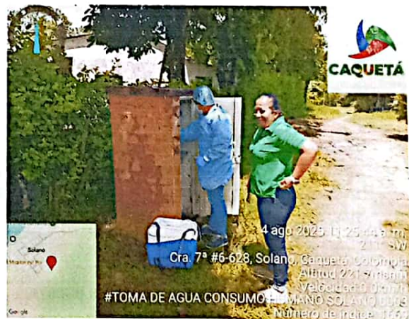
Evidencia 1. Muestreo de agua para Consumo Humano, Municipio de Solano punto No 0003, ubicado carrera 9 # 6 – 04 Frente al Ancianato

Producto 5: Informes de la participación en las reuniones o actividades de asistencia, capacitación y seguimiento requeridos por la DIRECCIÓN TÉCNICA, gobernación, ministerio de salud y protección social, entre otras referentes al objeto contractual, previo acuerdo con el supervisor contractual.