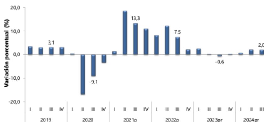
GRAFICO 1 PRODUCTO INTERNO BRUTO (PIB) TASA DE CRECIMIENTO ANUAL EN VOLUMEN 2019-I – 2024-III

https://www.dane.gov.co/files/operaciones/PIB/cp-PIB-IIItrim2024.pdf