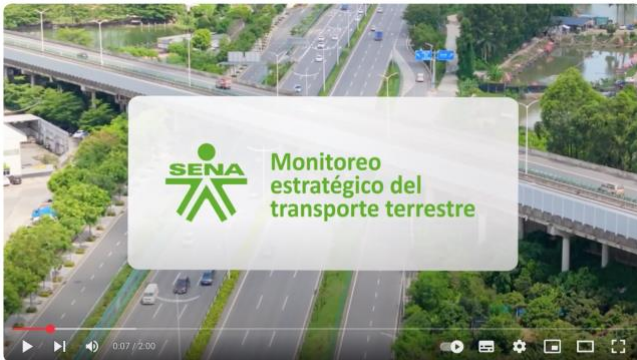
Monitoreo estratégico del transporte terrestre