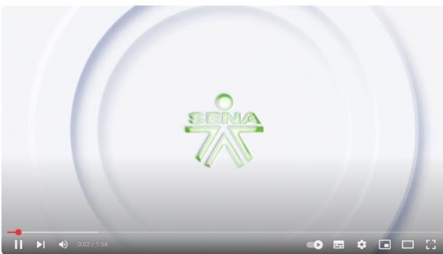
Evaluación de las operaciones logísticas de almacén

https://www.youtube.com/watch?v=74bvOrl7vEs