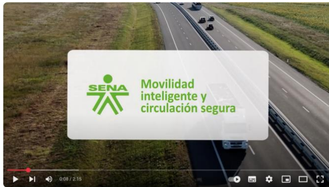
Movilidad inteligente y circulación segura