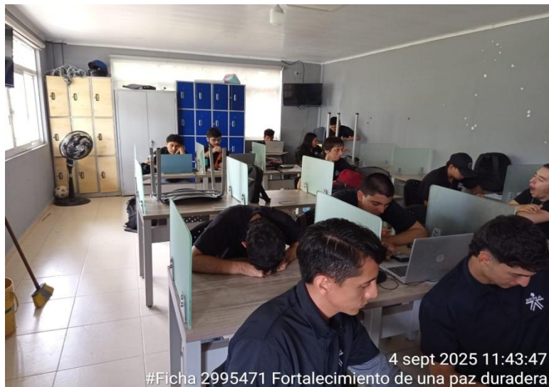
Formación ficha 2995471, análisis y desarrollo de software