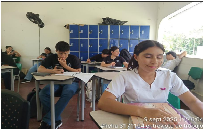
Formación: ficha 3171104: Procesamiento de alimentos