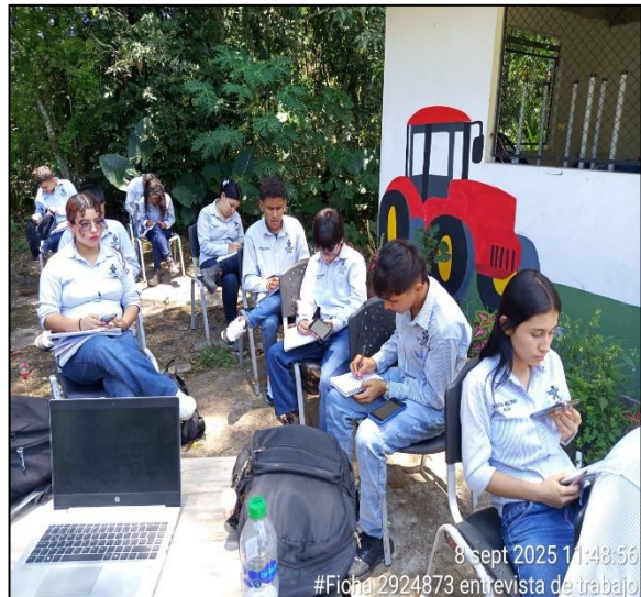
Formación: ficha: 2924873 tecnología gestión de la producción agrícola