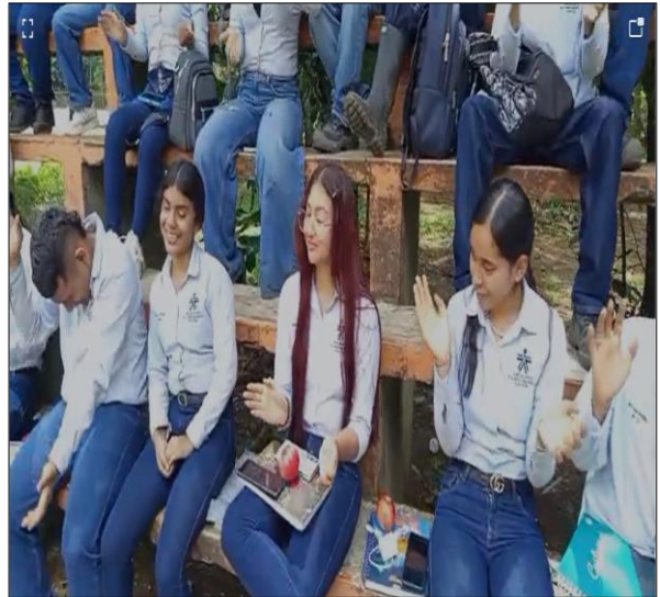
Formación ficha: 3171064 Gestión de la producción agrícola