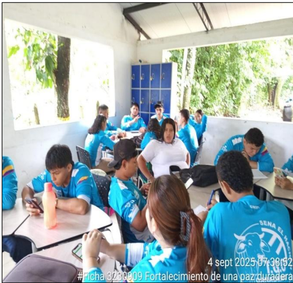
Formación: ficha 3230909 Producción ganadera