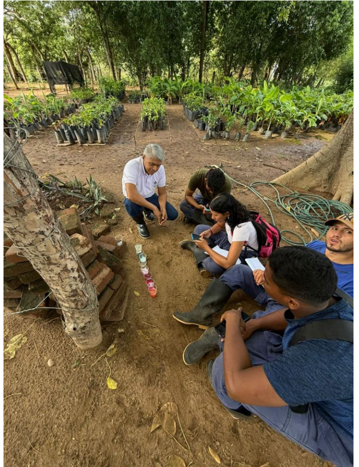
Trabajo en campo con la ficha de gestión de la producción agrícola