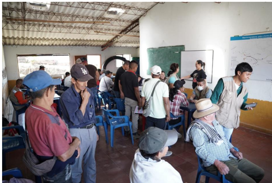
Reuniones explicándole a la comunidad el proyecto, los objetivos y resultados esperados de la investigación