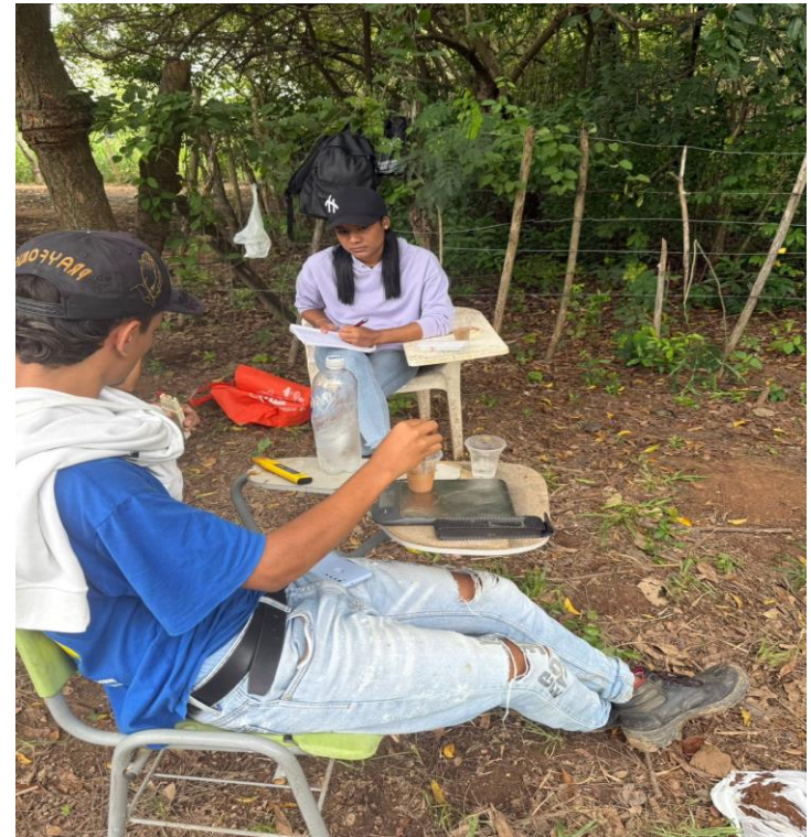
trabajos de aula y campo con las fichas de gestión de la producción agrícola y gestión de recursos naturales