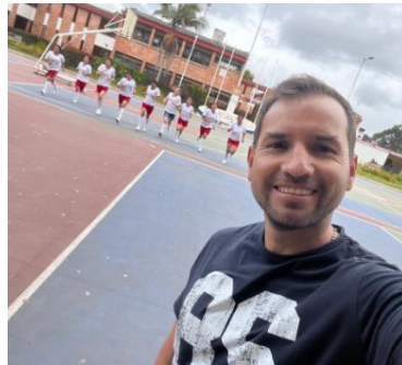
IE BOLIVAR SEPTIEMBRE 8