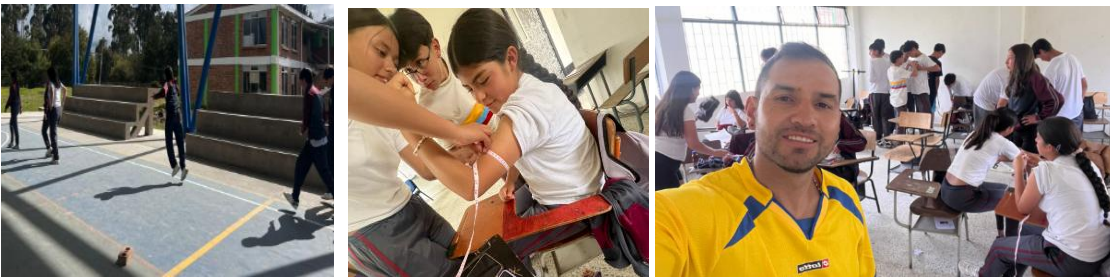
IE RUFINO CUERVO SEPTIEMBRE 3 FICHA GRADO 10