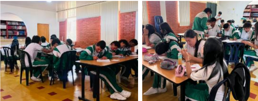
FICHA GRADO 11 SEPTIEMBRE 3