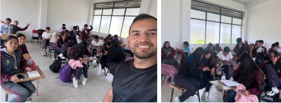
IE GONZALO JIMENEZ DE QUESADA SEPTIEMBRE 9