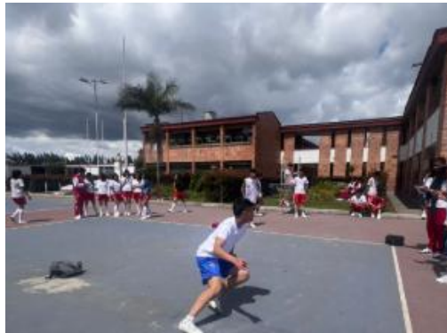
IE GONZALO JIMENEZ DE QUESADA SEPTIEMBRE 2