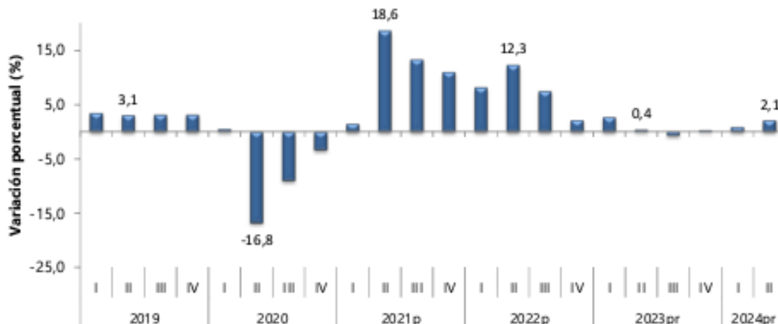
Gráfico 1. Producto Interno Bruto Tasa de crecimiento en volumen 1 2019-I / 2024 P -II