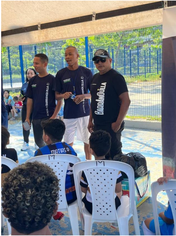
Actividades 22 de agosto de 2025.