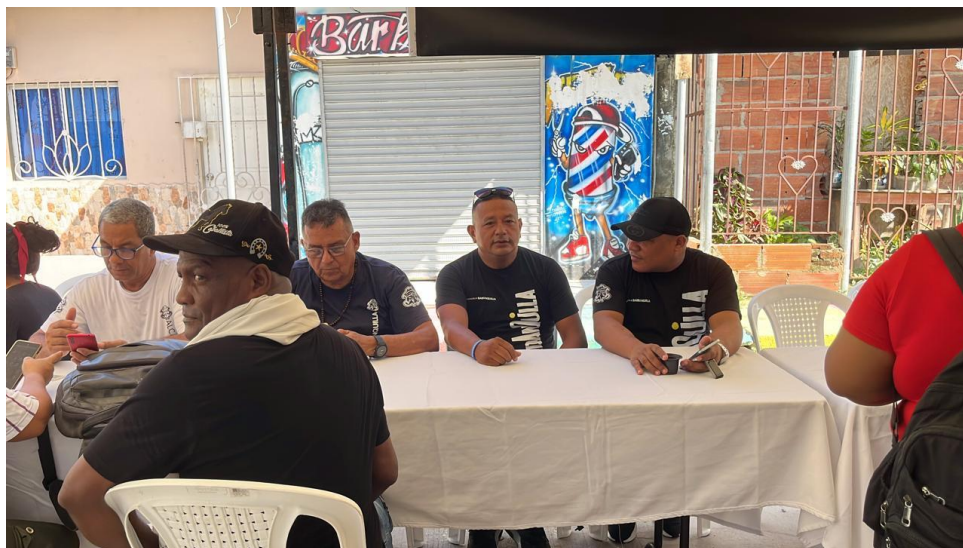
Actividades del 30 de agosto de 2025.