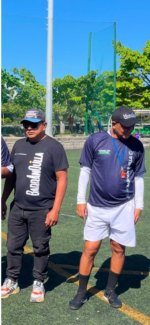
Actividades del 19 de agosto de 2025