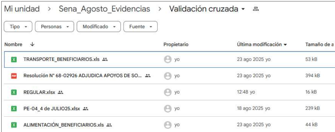
Evidencia 11- Evidencia fotográfica – Obligación # 14