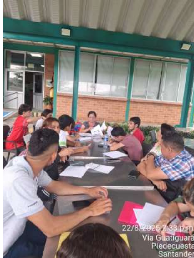
Evidencia 8- Evidencia fotográfica – Obligación # 11:

Evidencias fotográficas del desarrollo de las convocatorias.