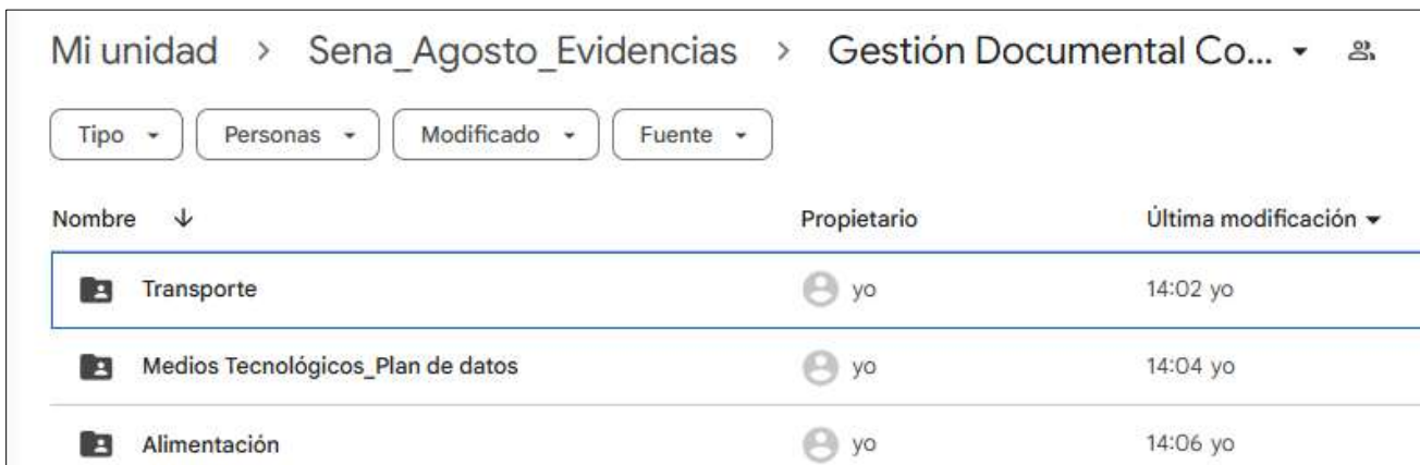
Evidencia 12- Evidencia fotográfica – Obligación # 15

Orientación e información sobre el proceso de inscripción a los diferentes apoyos socioeconómicos.